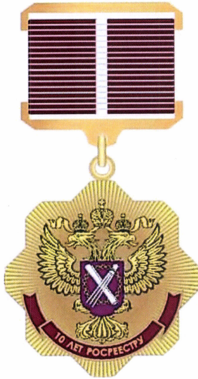
Рисунок нагрудного знака «10 лет Росреестру»