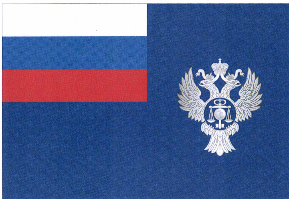
Рисунок флага Федерального казначейства

Приложение № 5 к приказу Министерства финансов Российской Федерации от 10.05.2023 г. № 66н