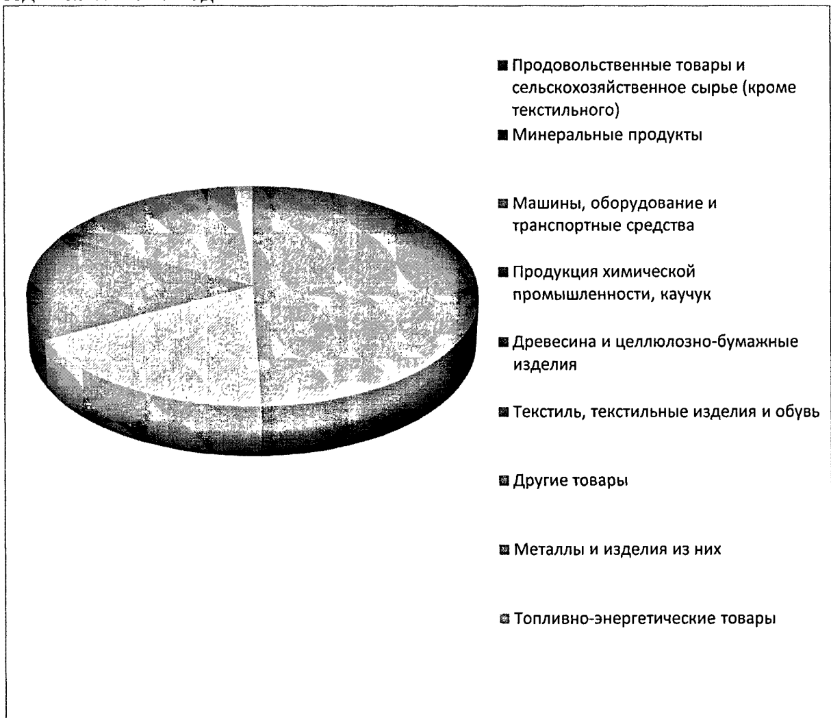
Рисунок 1. Товарная структура экспорта Республики Адыгея за 2020 год

На диаграмме представлена товарная структура экспорта Республики Адыгея за 2020 год.