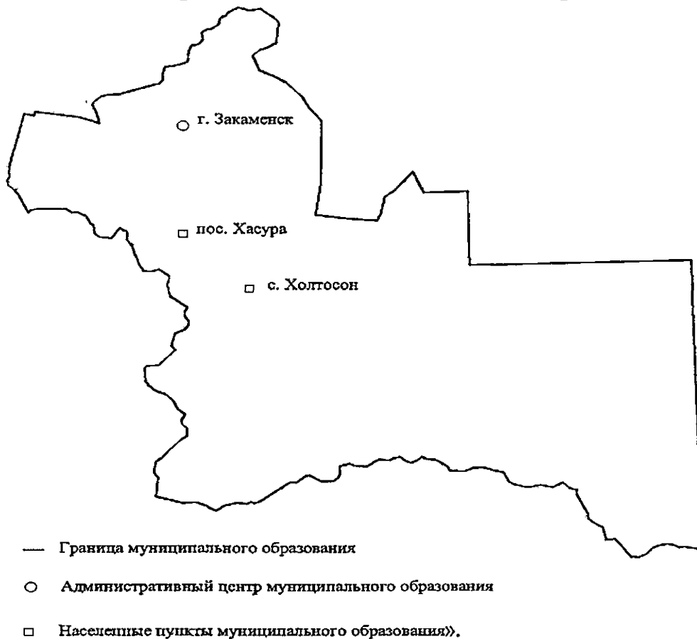
Схема границ муниципального образования «Город Закаменск» в Закаменском районе

зования «Хужирское». От точки Е. строго в южном направлении до точки З. граничит с землями муниципального образования «Нуртинское». От точки З. до точки Ж. проходит государственная граница с Монголией. От точки Ж. северное направление до точки А. граничит с муниципальным образованием «Хамнейское». От точки А. в северную сторону в виде ломаной линии до точки Р. граничит с землями муниципального образования «Бургуйское». От точки Р. строго восточное направление протяженностью 6 км., далее в северном направлении протяженностью 4 км. далее меняется в восточном направлении протяженностью 2 км и граничит с землями муниципального образования «Ехэ-Цакирское». От точки Х. в северном направлении протяженностью 1,7 км, далее меняет направление на юго-восток протяженностью 3,2 км, меняет направление на восток 2,8 км, граничит с землями муниципального образования «Дутулурское». От точки Б. до точки Д. в северном направлении граничит с землями муниципального образования «Дутулурское».