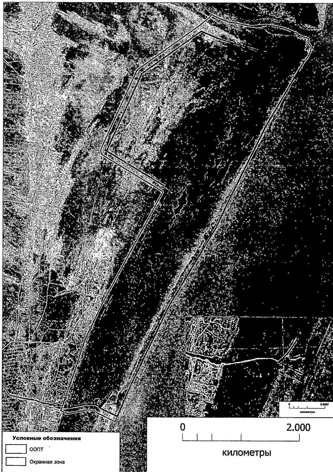
Схема границ лиманно-плавневого комплекса «Сулакская лагуна» и его охранной зоны