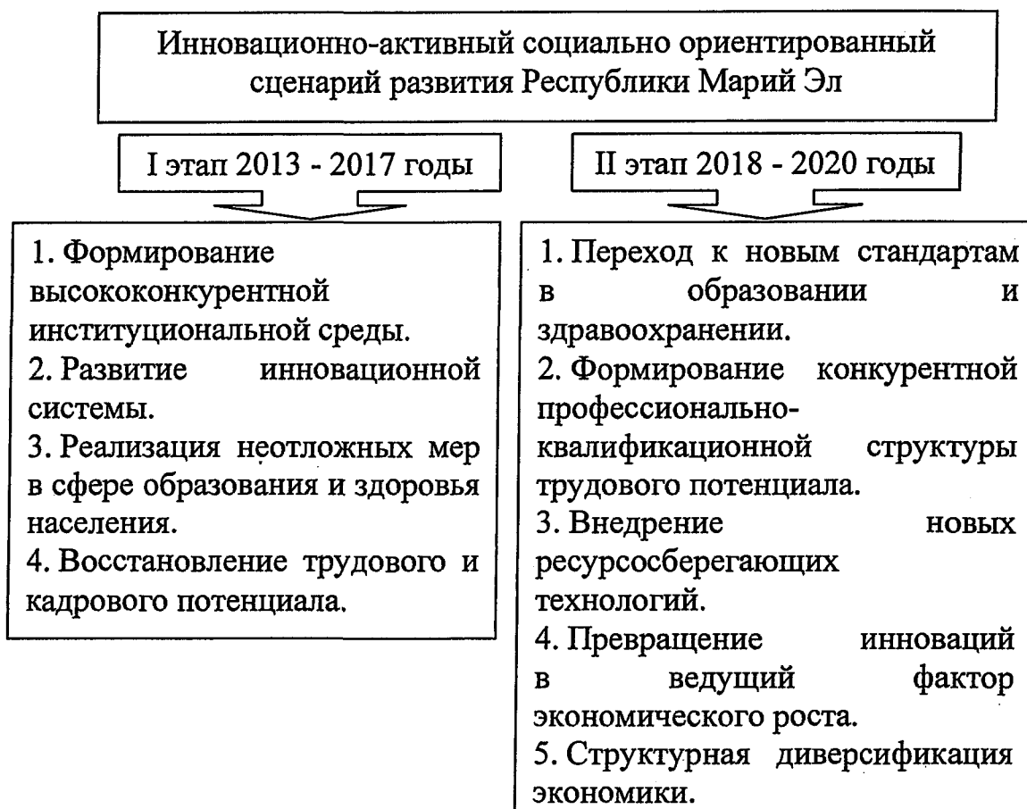
Таблица № 2