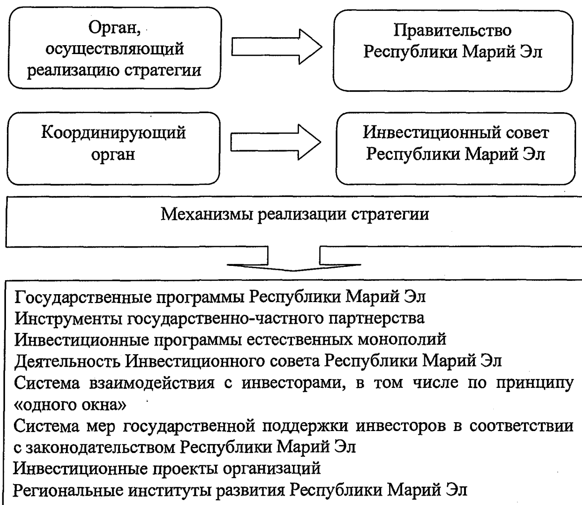
Рисунок № 3

Выполнение Стратегии будет осуществляться посредством планов мероприятий по ее реализации, выполнение которых будет оцениваться по достижению целевых показателей Стратегии согласно приложению № 1 к Стратегии.