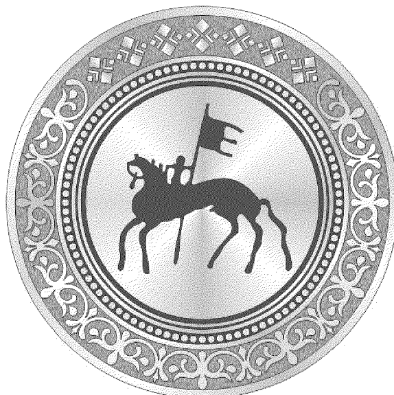
РИСУНОК нагрудного знака к Грамоте Правительства Республики Саха (Якутия)

постановлению Правительства Республики Саха (Якутия) от 06 декабря 2019 г. № 358