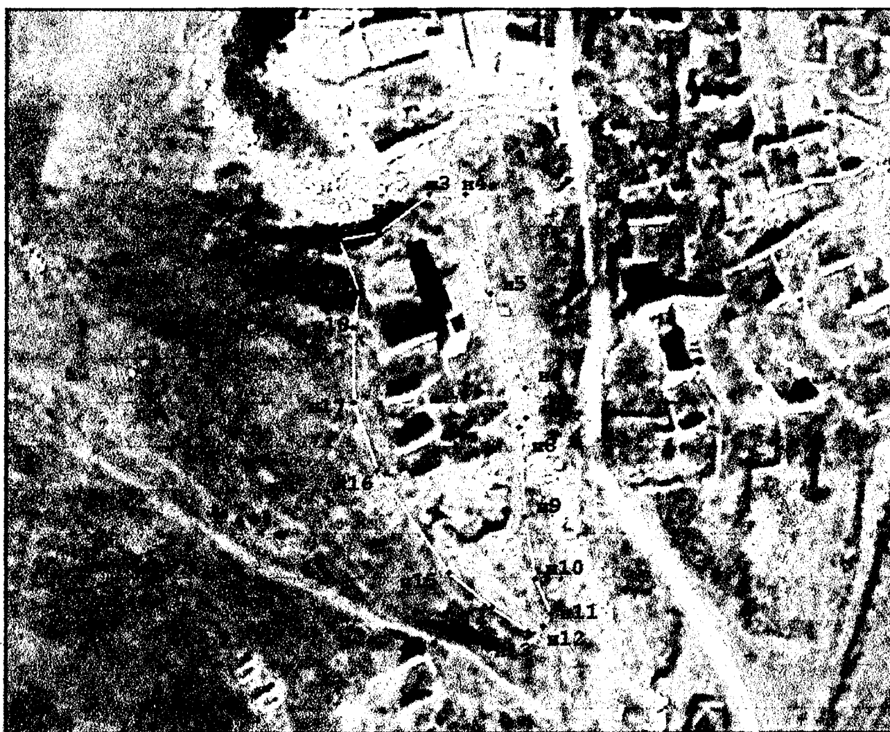
Граница объекта культурного наследия