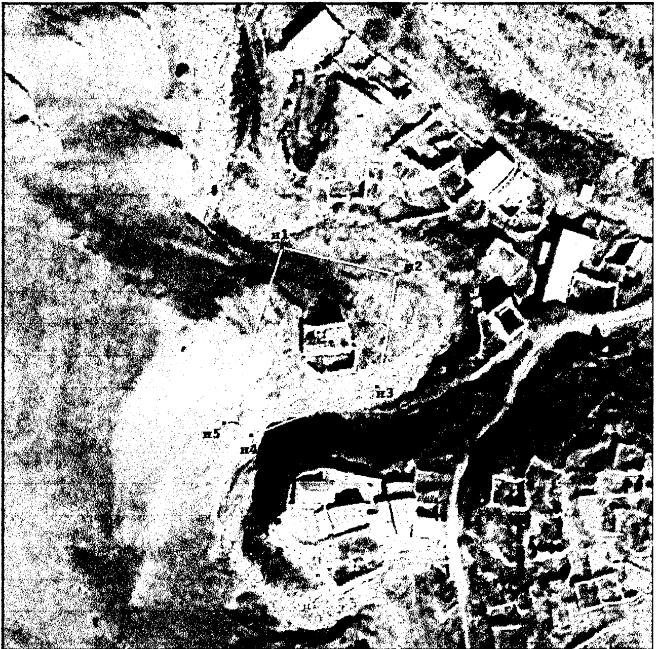
Граница объекта культурного наследия