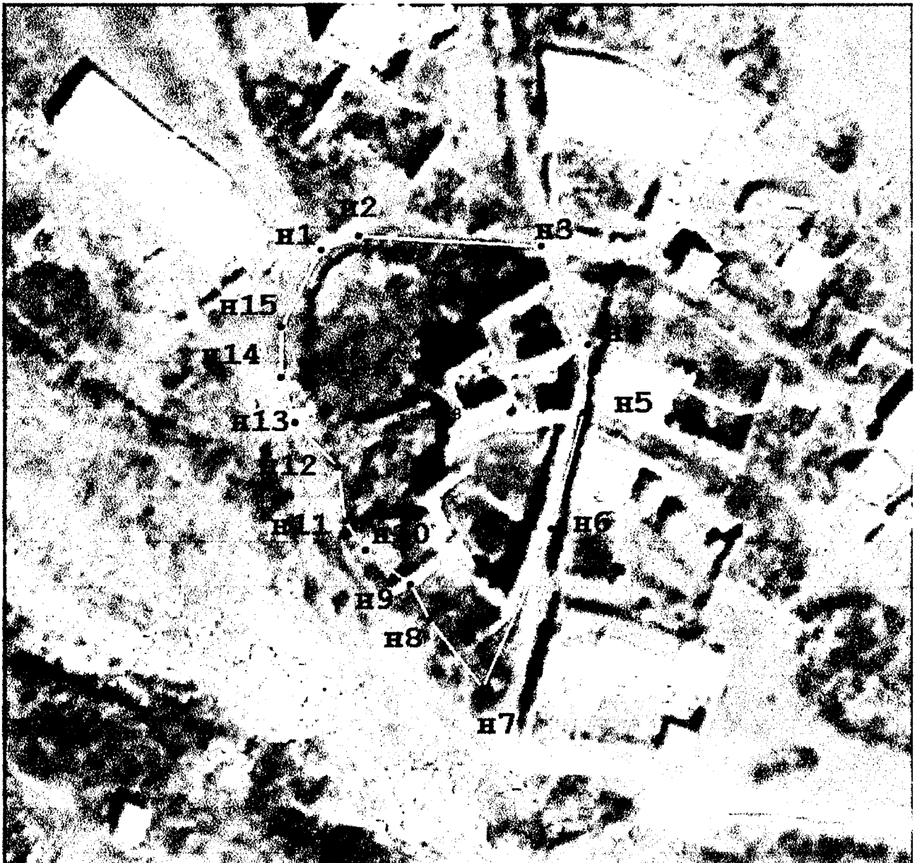
Граница объекта культурного наследия