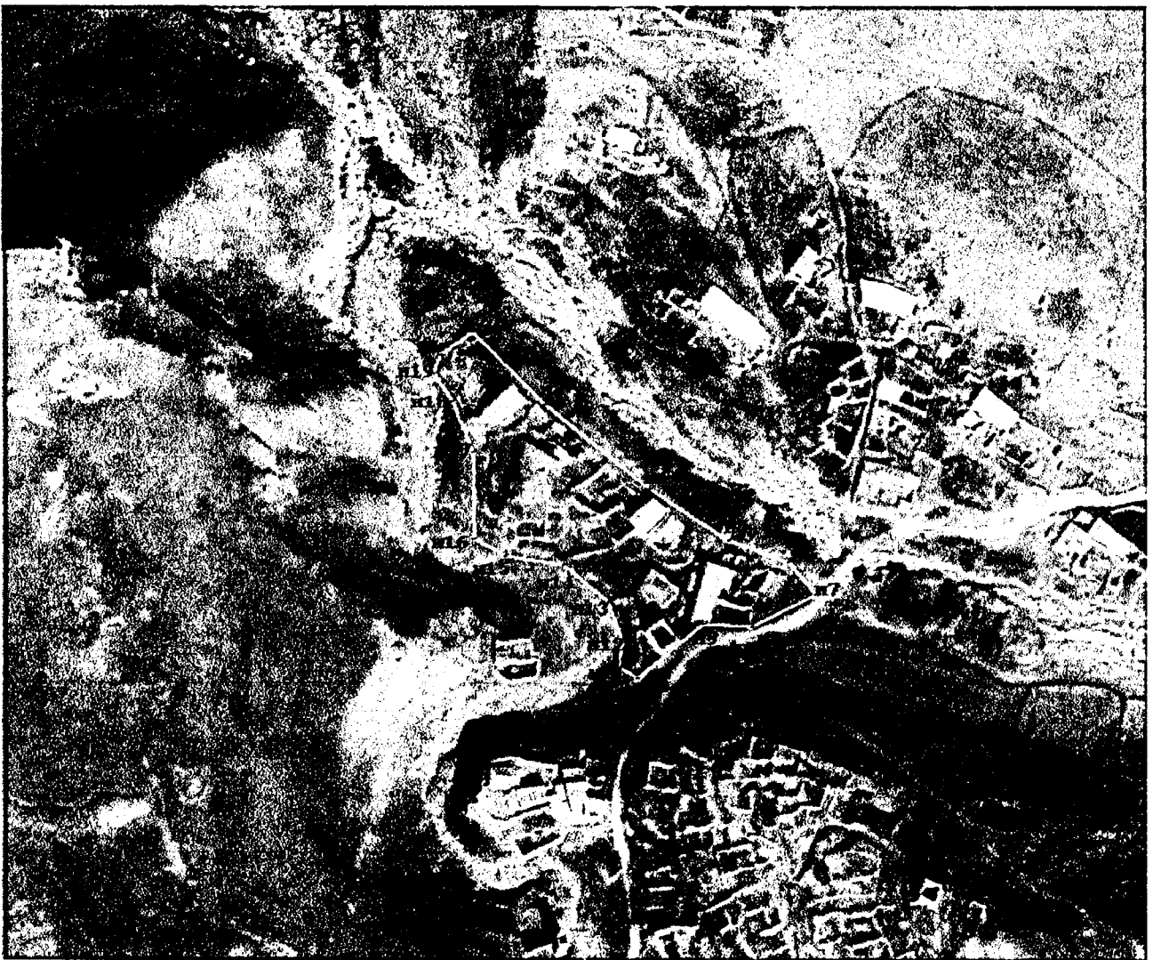
Граница объекта культурного наследия