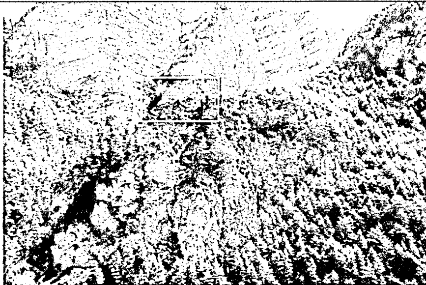
Вид с запада