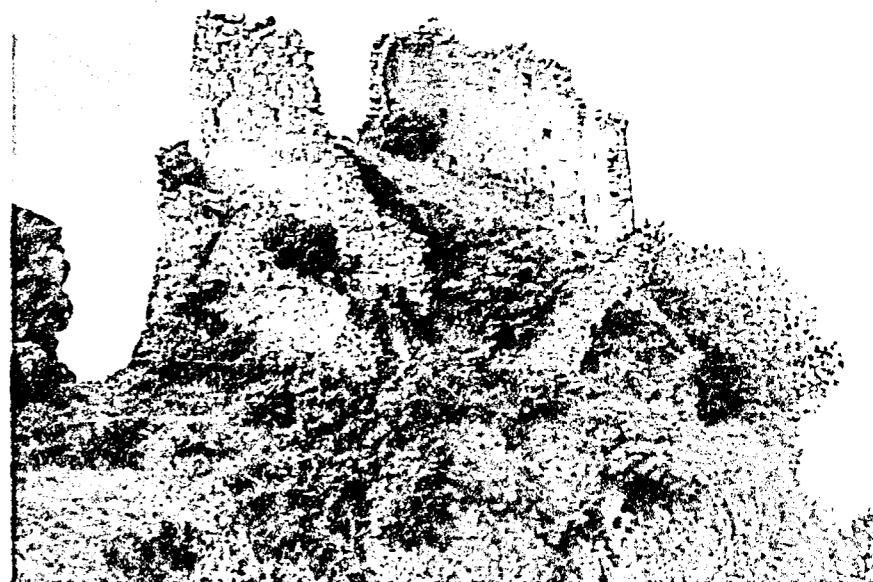
Фото 1973 г. Вид с северо-востока.