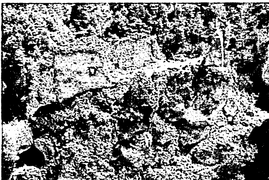
Вид с запада.

Типологические характеристики, включая объемно-планировочное решение. Обособленное укрепление на высоком скальном останце – замок. Размеры и неправильная форма башни в плане обусловлены размерами и формой подработанного скального основания