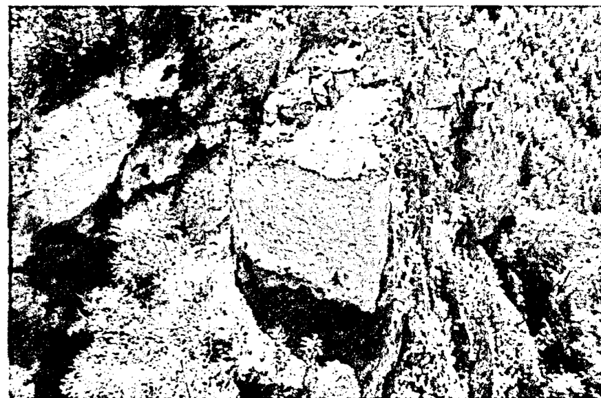
Вид с север-северо-запада