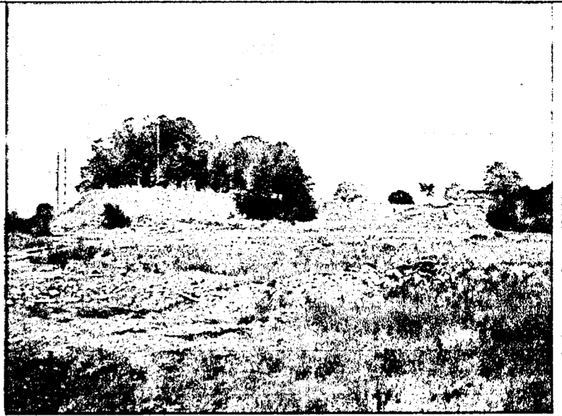
Вид с юга.

7 Археологический подъемный материал в границах территории Памятника. Расположенные под дерновым слоем пласты грунтов, образовавшиеся в процессе жизнедеятельности человека и содержащие в себе недвижимые остатки и предметы материальной культуры: а) полностью или частично скрытые в земле остатки и фрагменты хозяйственных, производственных, ритуальных и иных сооружений; б) полностью или частично скрытые в земле либо находящиеся на ее поверхности целые либо фрагментированные предметы, изготовленные из глины, камня, кости, стекла, металлов и иных материалов, в том числе остеологического материала.