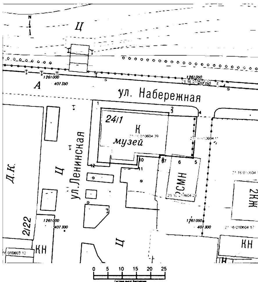
Схема границ территории объекта культурного наследия (памятника истории и культуры) регионального (республиканского) значения «Каменный двухэтажный дом, II пол. XIX в.», расположенного по адресу: Чувашская Республика, Мариинско-Посадский район, г. Мариинский Посад, ул. Ленинская, д. 1 (далее - объект культурного наследия):

Условные обозначения: Месторасположение объекта культурного наследия Граница земельного участка учтенного в ГКН Кадастровый номер земельного участка Система координат МСК-21 Система высот Балтийская Сплошные горизонтали проведены через 1 м