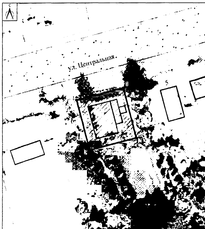
Схема границ территории объекта культурного наследия регионального (республиканского) значения «Дом жилой», 1870 г., расположенного по адресу: Чувашская Республика, Чебоксарский муниципальный округ, с. Ишаки, ул. Центральная, зд. 7 (далее - объект культурного наследия).