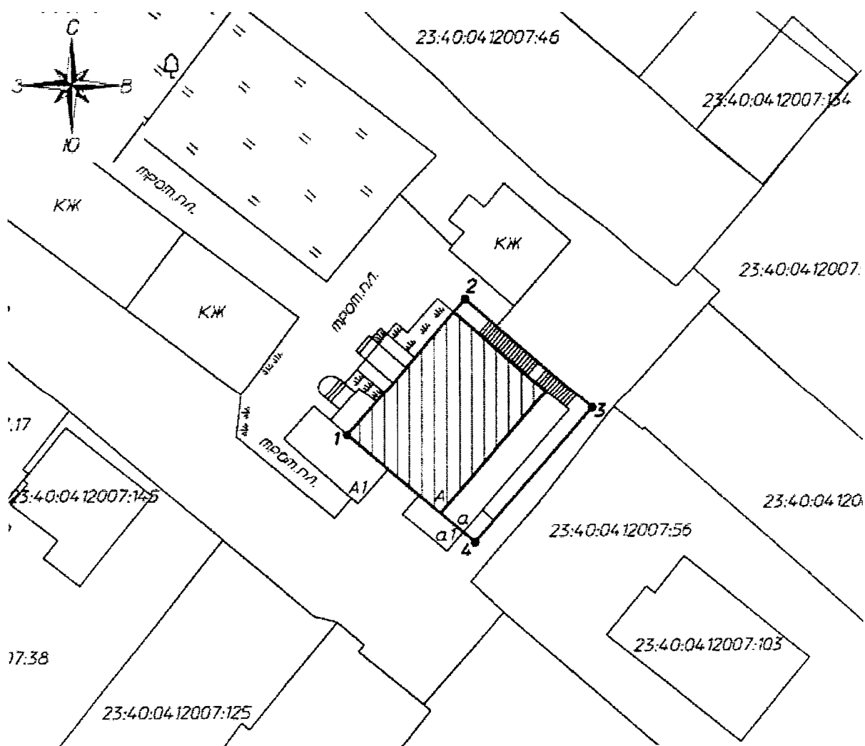
Карта (схема) границ территории объекта культурного наследия