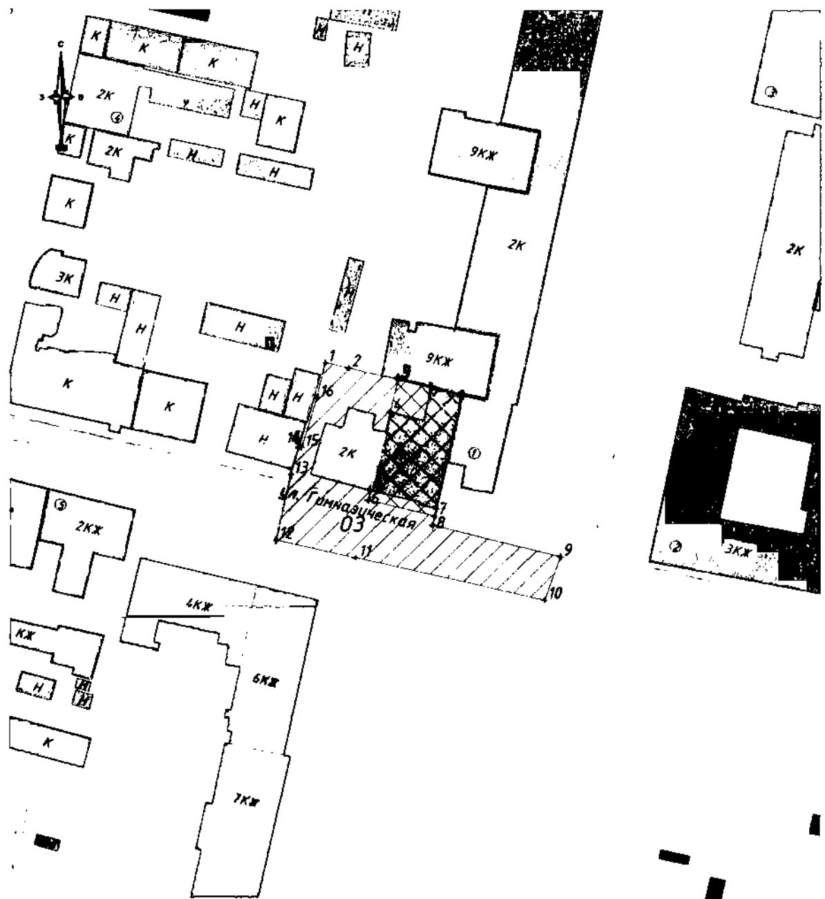
Карта (схема) границ охранной зоны объекта культурного наследия (ОЗ)