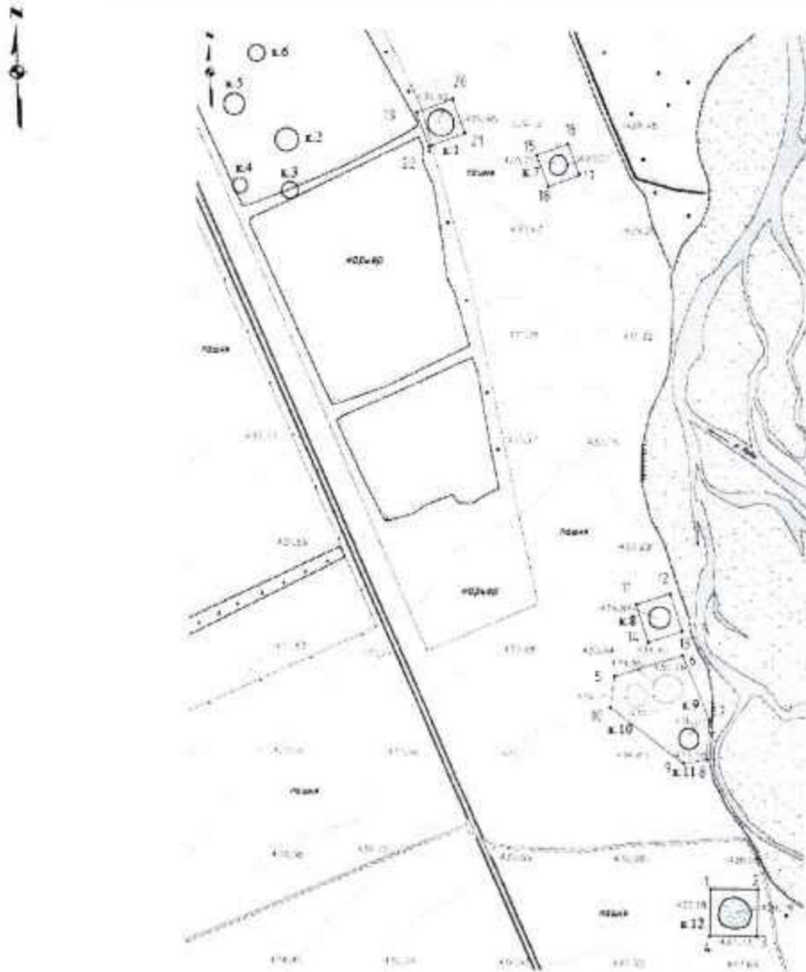
Карта (схема) границ территории объекта культурного наследия