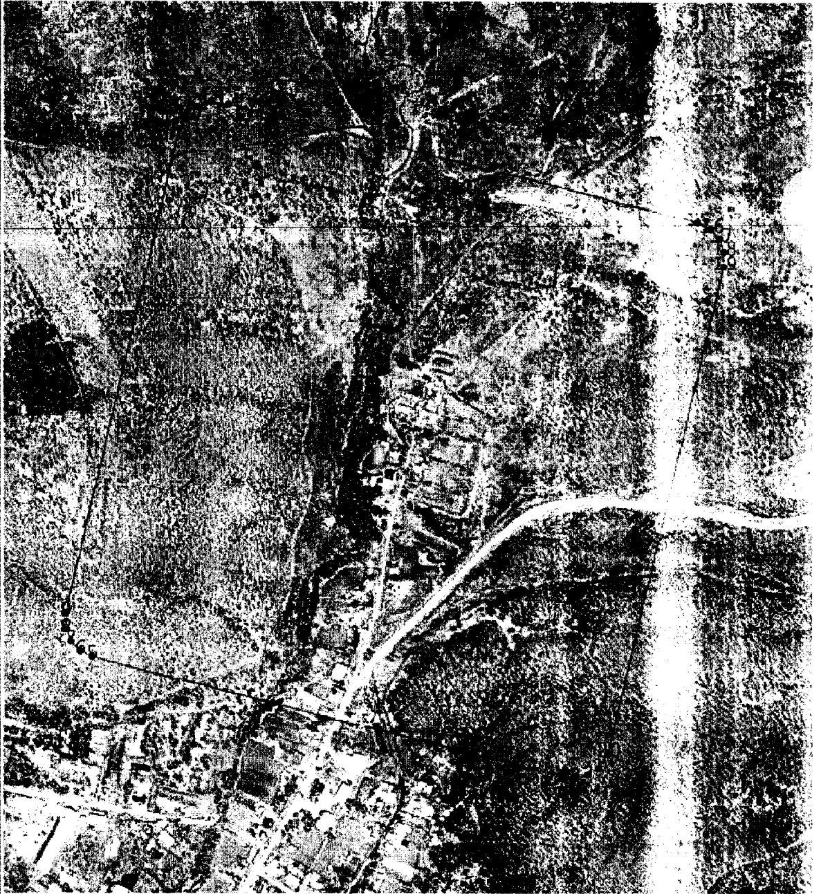
Масштаб 1:7 000

Используемые условные знаки и обозначения: