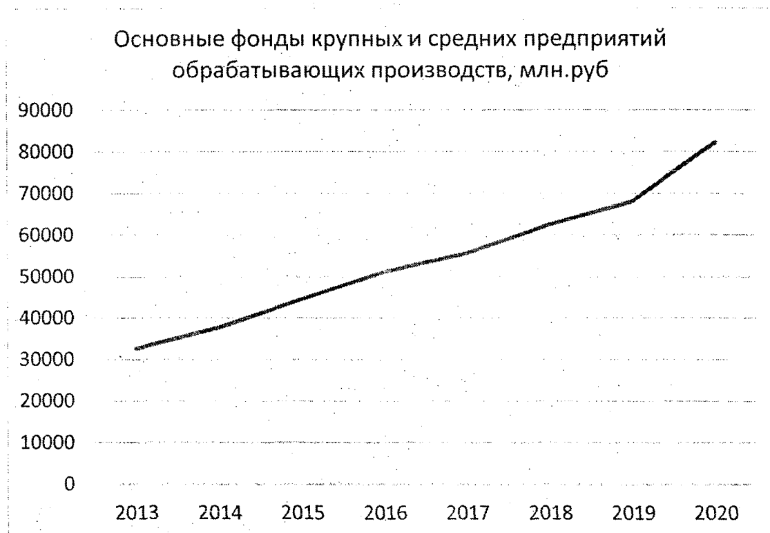
Рисунок 5 - Основные фонды крупных и средних предприятий обрабатывающих производств в Брянской области в 2013 – 2020 гг. 2

поддержки по сравнению с предыдущими видами деятельности должен быть тоже ниже.