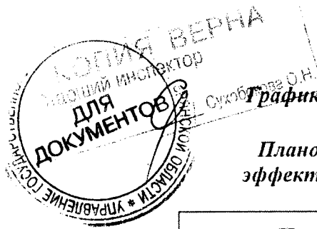
График реализации мероприятий производственной программы - с момента вступления в силу по 31 декабря 2021 года.

Плановые значения показателей надежности, качества и энергетической эффективности объектов централизованных систем водоснабжения и (или) водоотведения.