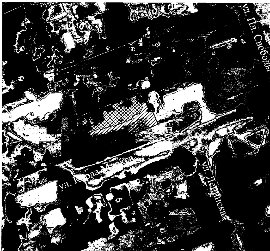
Схема границ территории объекта культурного наследия регионального значения «Церковь Никольско-Вознесенская (летняя)»