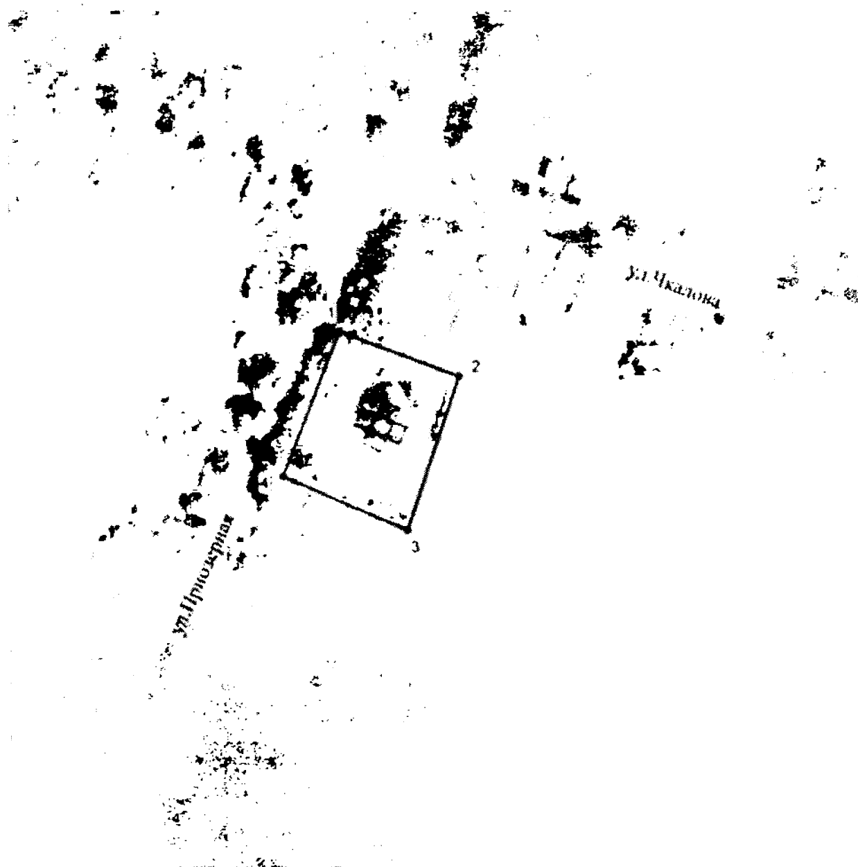
Схема границ территории объекта культурного наследия регионального значения «Церковь Покровская»