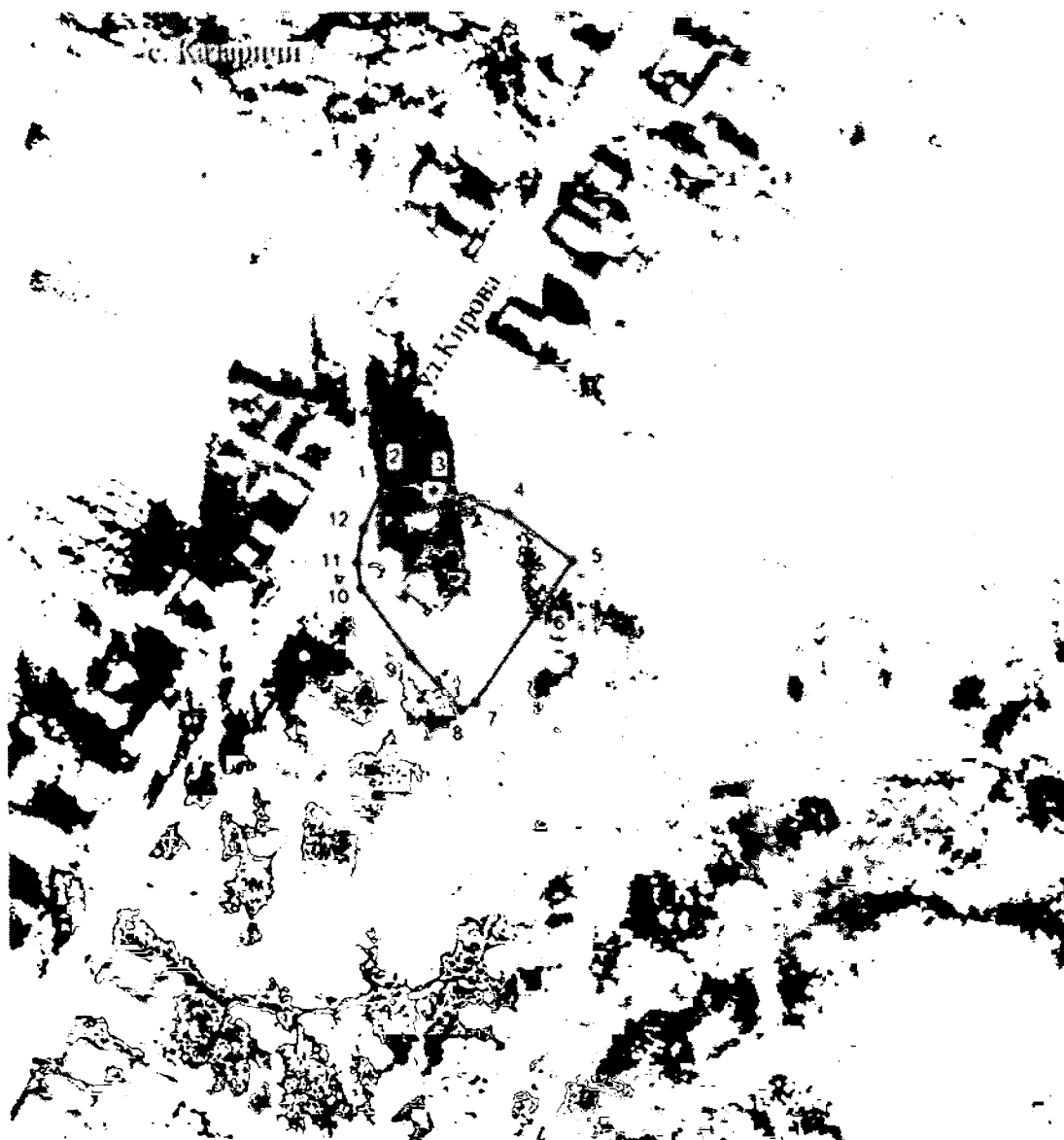
Схема границ территории объекта культурного наследия регионального значения «Никольская церковь»