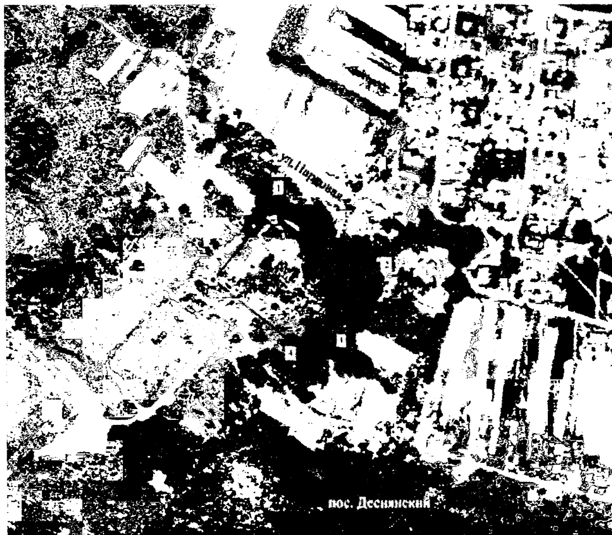
Схема границ территории объекта культурного наследия регионального значения «Усадебный дом»