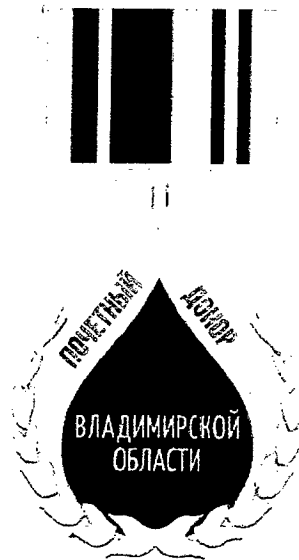
РИСУНОК ПОЧЕТНОГО ЗНАКА «ПОЧЕТНЫЙ ДОНОР ВЛАДИМИРСКОЙ ОБЛАСТИ»

к Закону Владимирской области от 07.11.2016 № 126-ОЗ