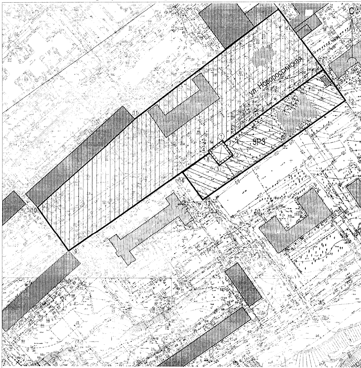
Схема границ зон охраны объекта культурного наследия регионального значения "Жилой дом (Детский сад № 44)", расположенного по адресу: г. Волгоград, ул. Новороссийская, 28