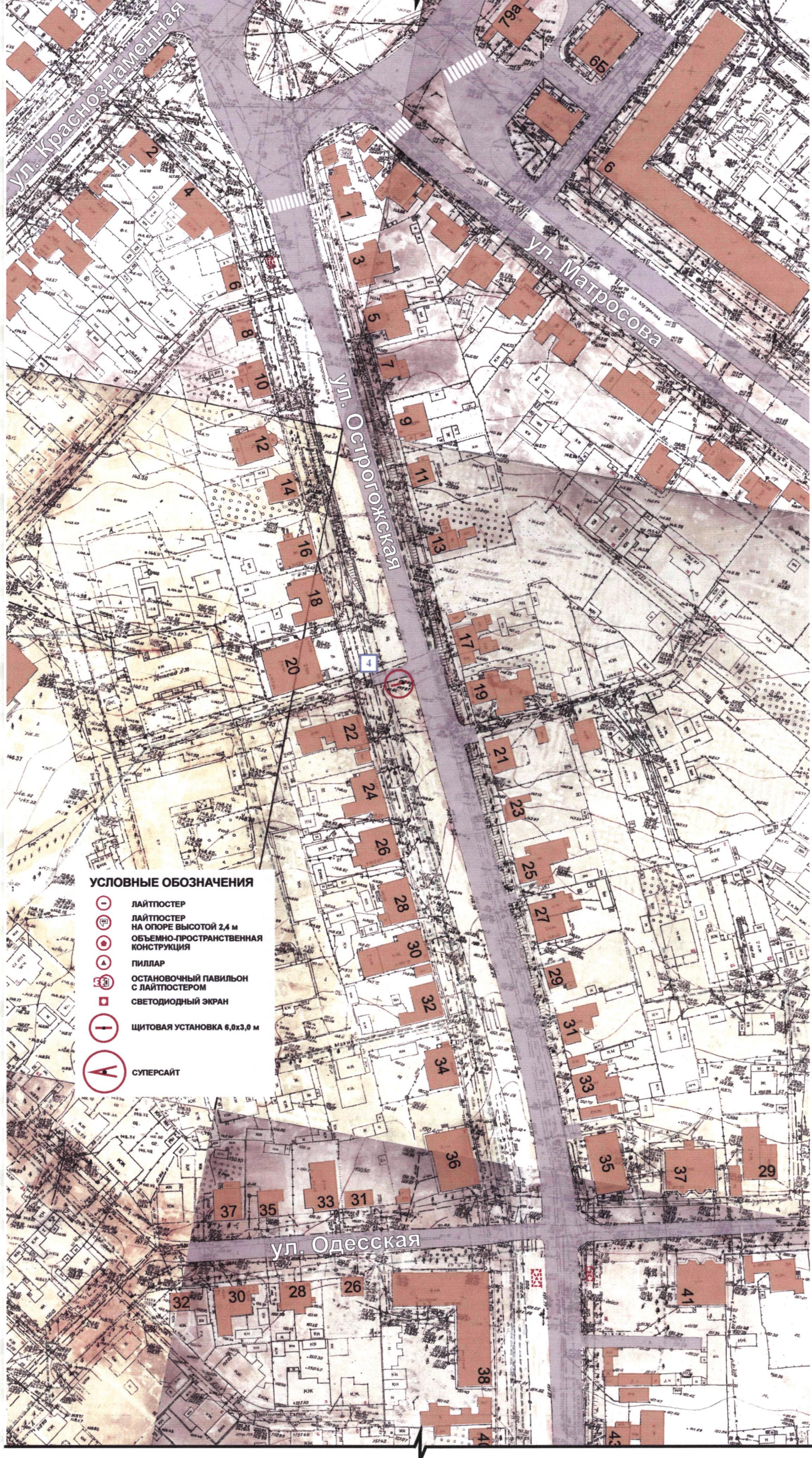
СХЕМА РАЗМЕЩЕНИЯ РЕКЛАМНЫХ КОНСТРУКЦИЙ НА ТЕРРИТОРИИ ГОРОДСКОГО ОКРУГА ГОРОД ВОРОНЕЖ ДЛЯ УЧАСТКА ТЕРРИТОРИИ: улица Острогжская М 1:1000