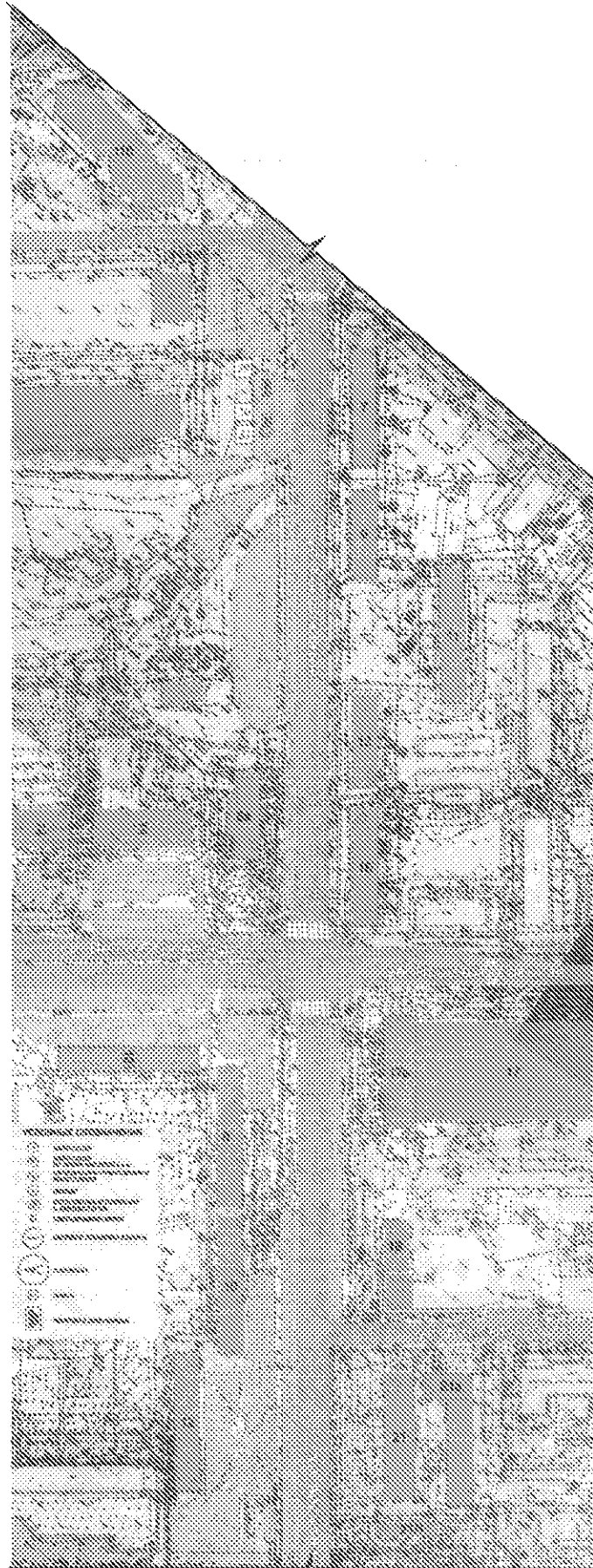
СХЕМА РАЗМЕЩЕНИЯ РЕКЛАМНЫХ КОНСТРУКЦИЙ НА ТЕРРИТОРИИ ГОРОДСКОГО ОКРУГА ГОРОД ВОРОНЕЖ ДЛЯ УЧАСТКА ТЕРРИТОРИИ: улица Космонавтов М 1:1000