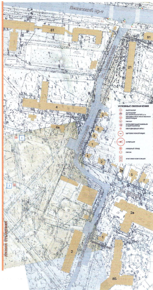
СХЕМА РАЗМЕЩЕНИЯ РЕКЛАМНЫХ КОНСТРУКЦИЙ НА ТЕРРИТОРИИ ГОРОДСКОГО ОКРУГА ГОРОД ВОРОНЕЖ ДЛЯ УЧАСТКА ТЕРРИТОРИИ: улица Арзамасская М 1:1000