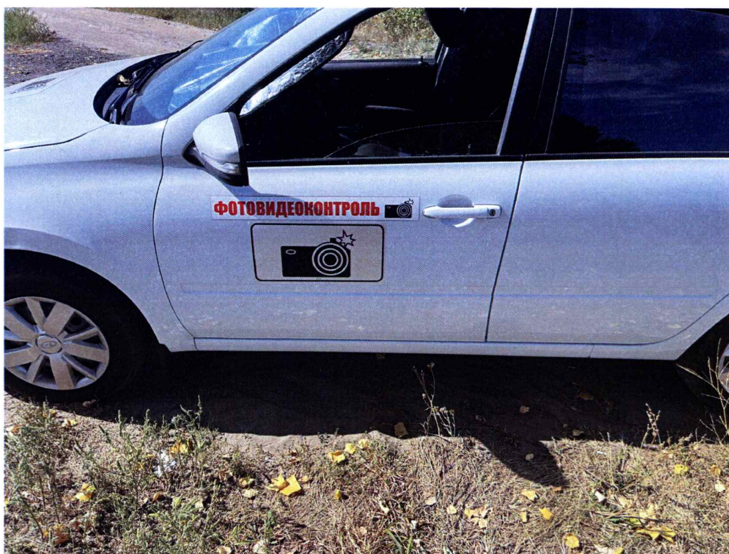
Опознавательные знаки на передней двери водителя транспортного средства