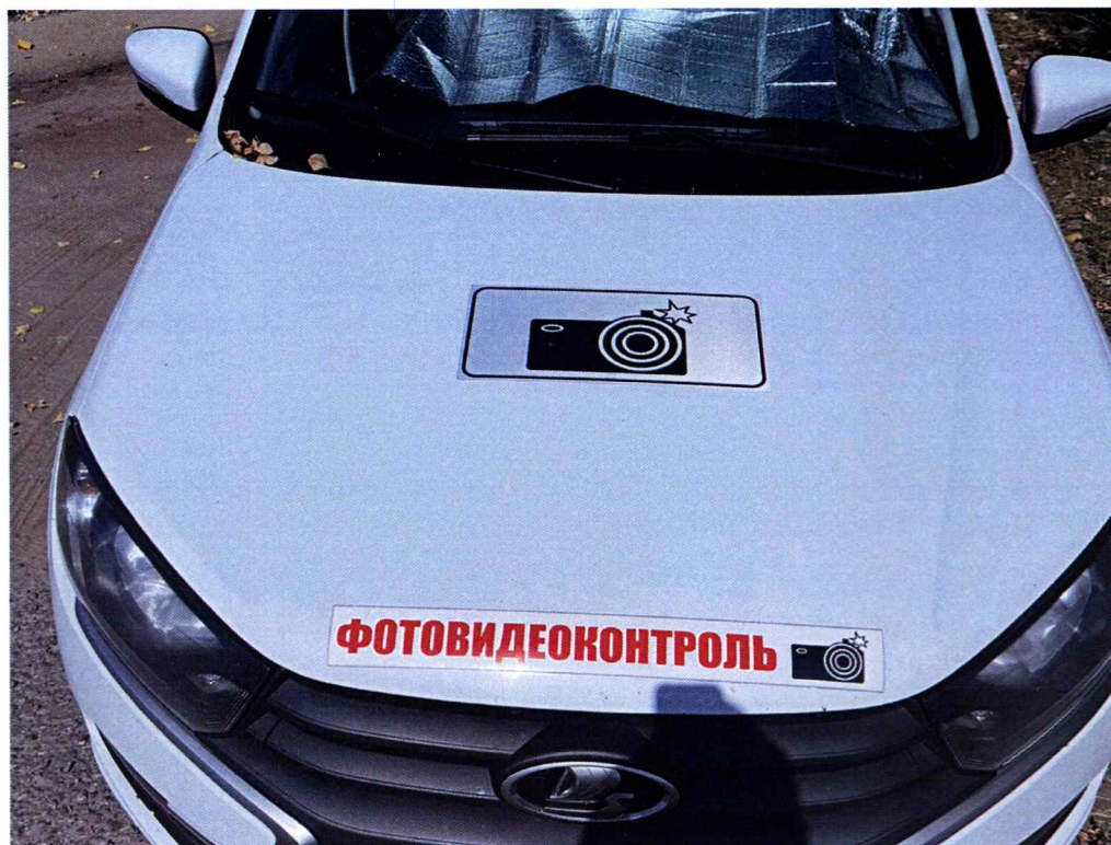
Опознавательные знаки на капоте транспортного средства