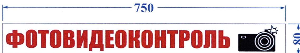
Опознавательный знак «Фотовидеоконтроль»