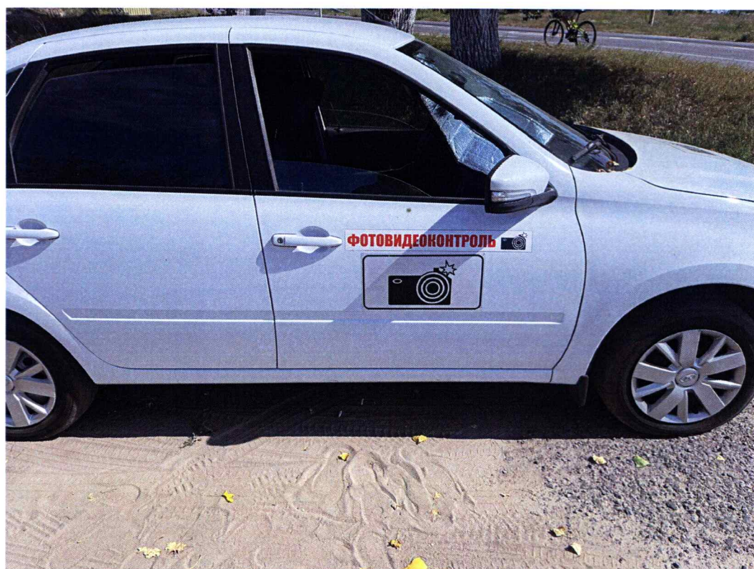
Опознавательные знаки на передней двери пассажира транспортного средства