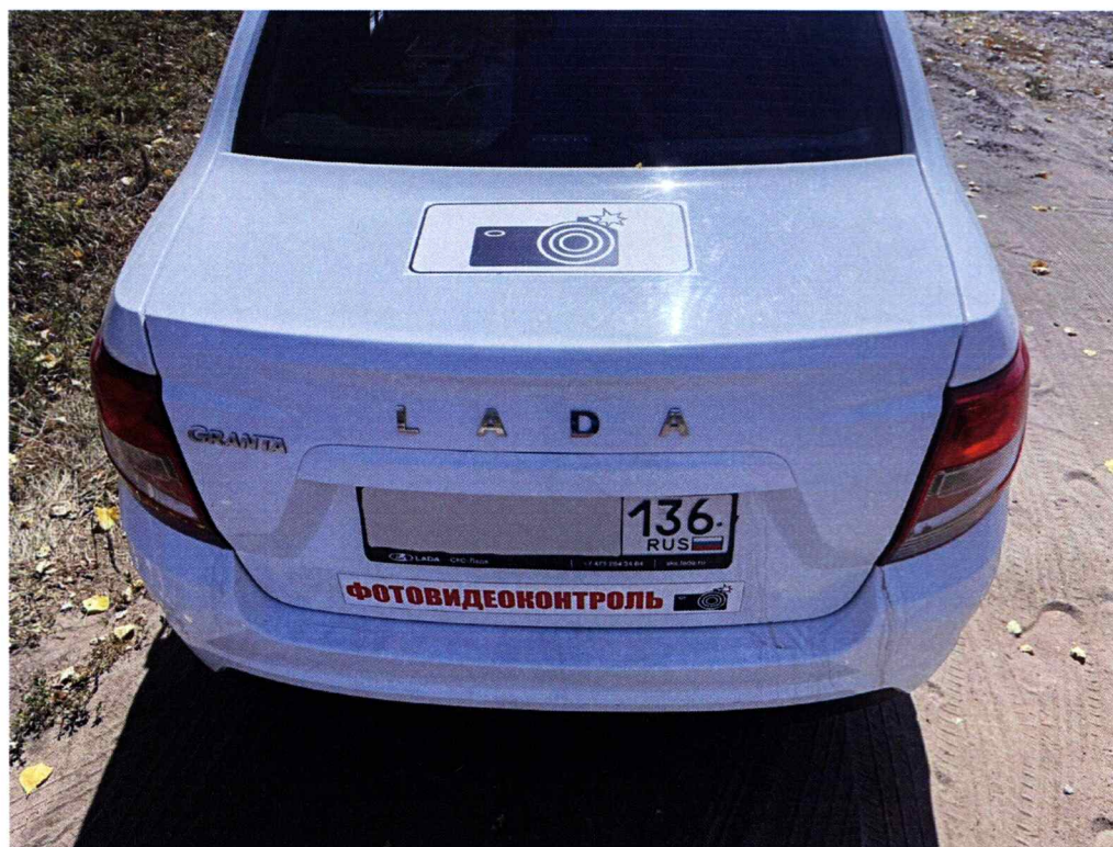
Опознавательные знаки на крышке багажника транспортного средства