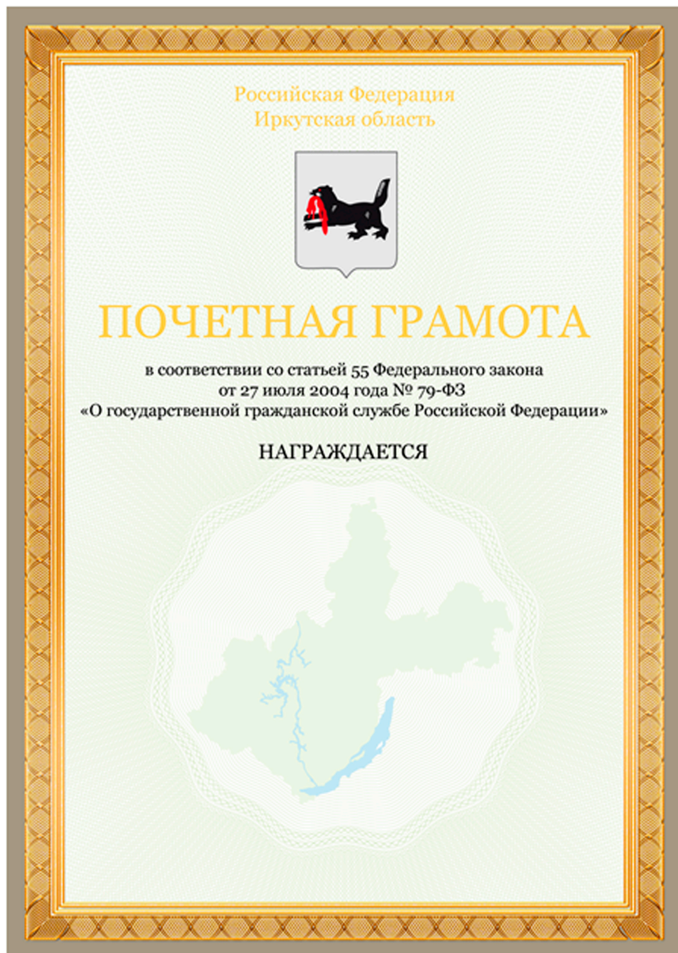
РИСУНОК БЛАНКА ПОЧЕТНОЙ ГРАМОТЫ