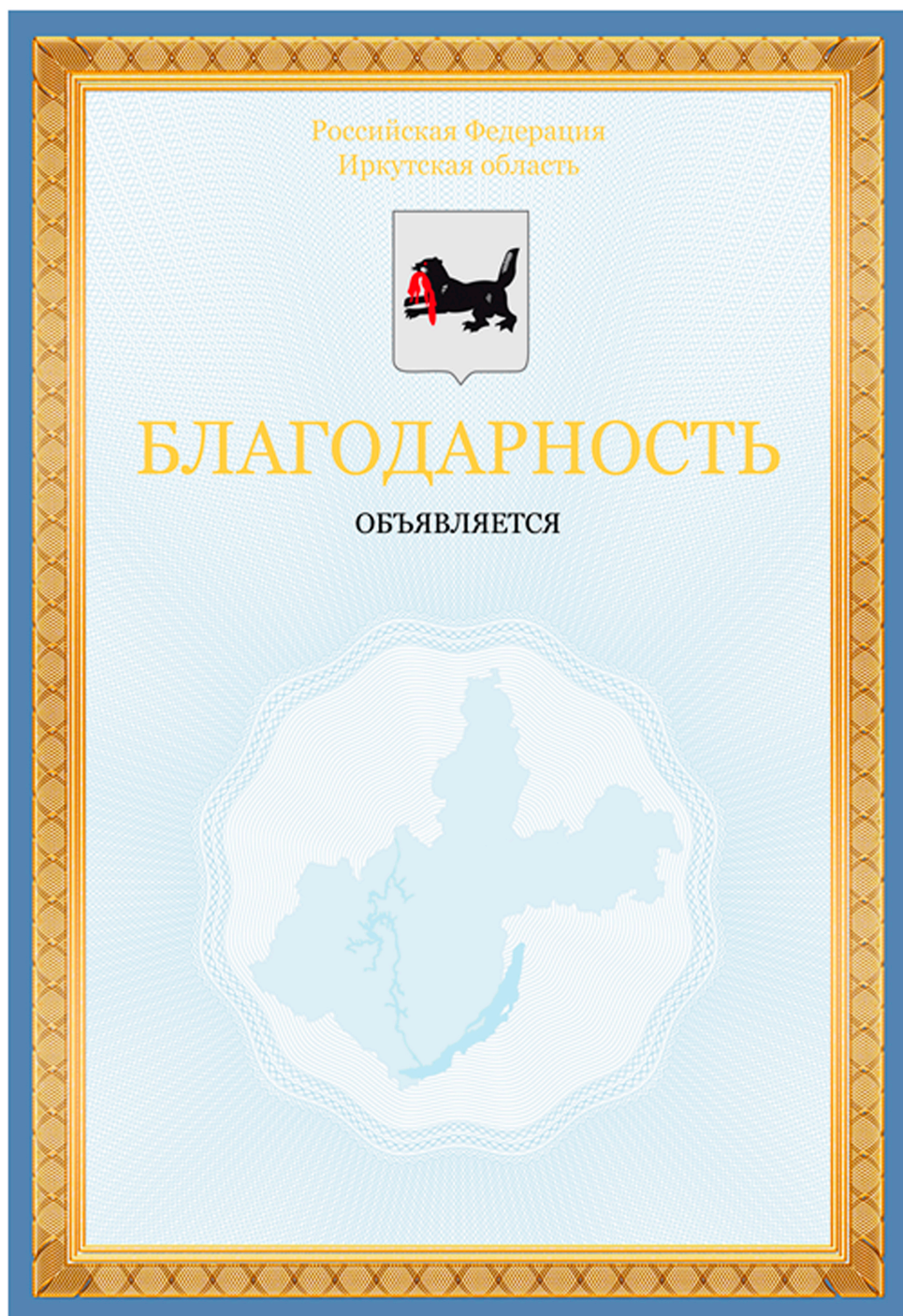
РИСУНОК БЛАНКА БЛАГОДАРНОСТИ

Приложение к описанию бланка благодарности