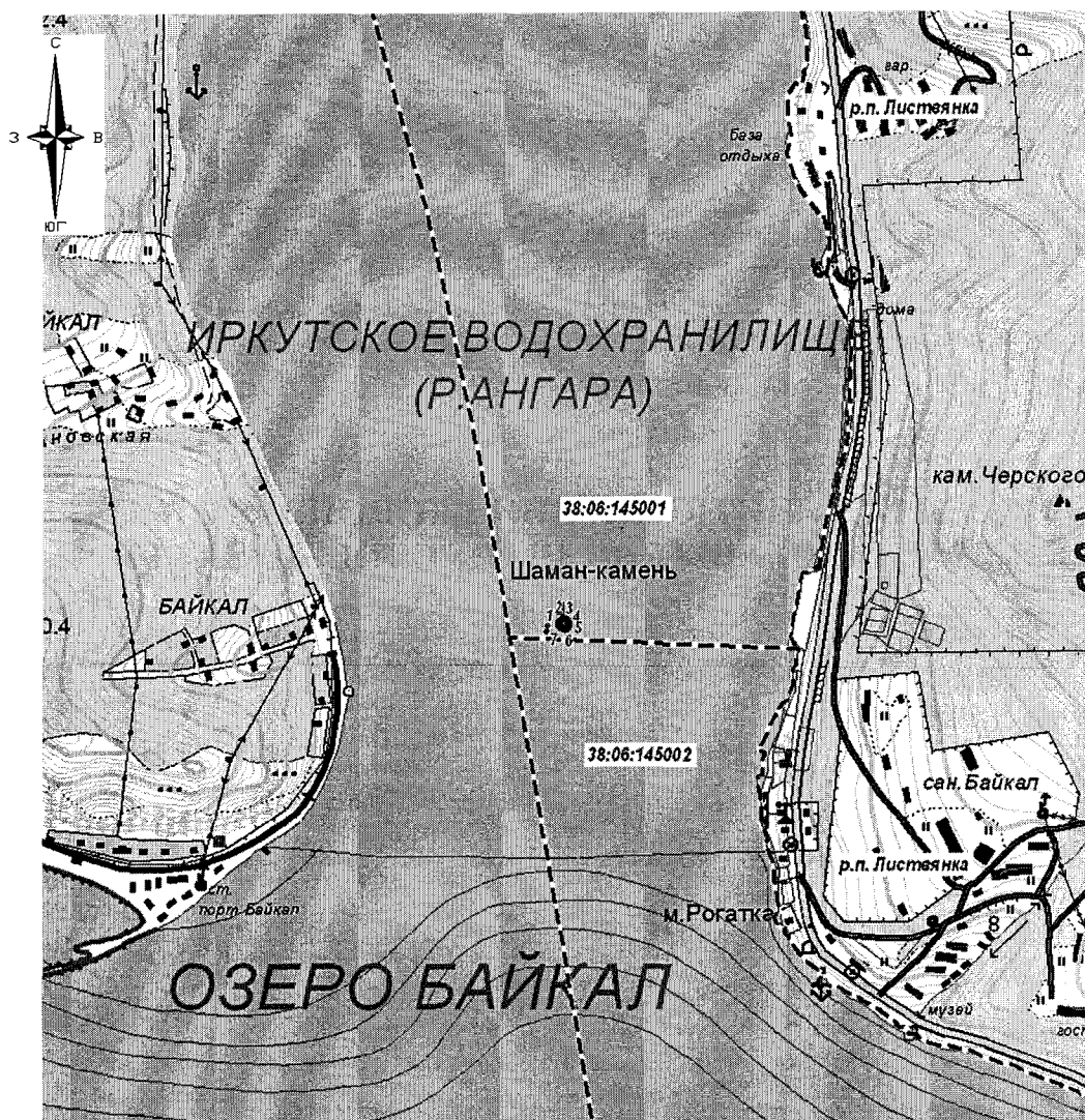
СХЕМА РАСПОЛОЖЕНИЯ ПАМЯТНИКА ПРИРОДЫ РЕГИОНАЛЬНОГО ЗНАЧЕНИЯ «ШАМАН-КАМЕНЬ»