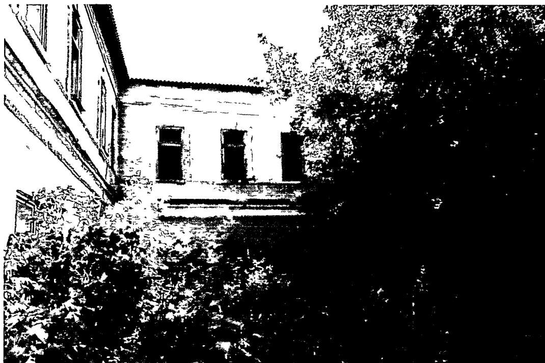
Фото Н.В. Шастун, август 2018 г.

(Лит. К) Вид на здание с северо-западного угла.