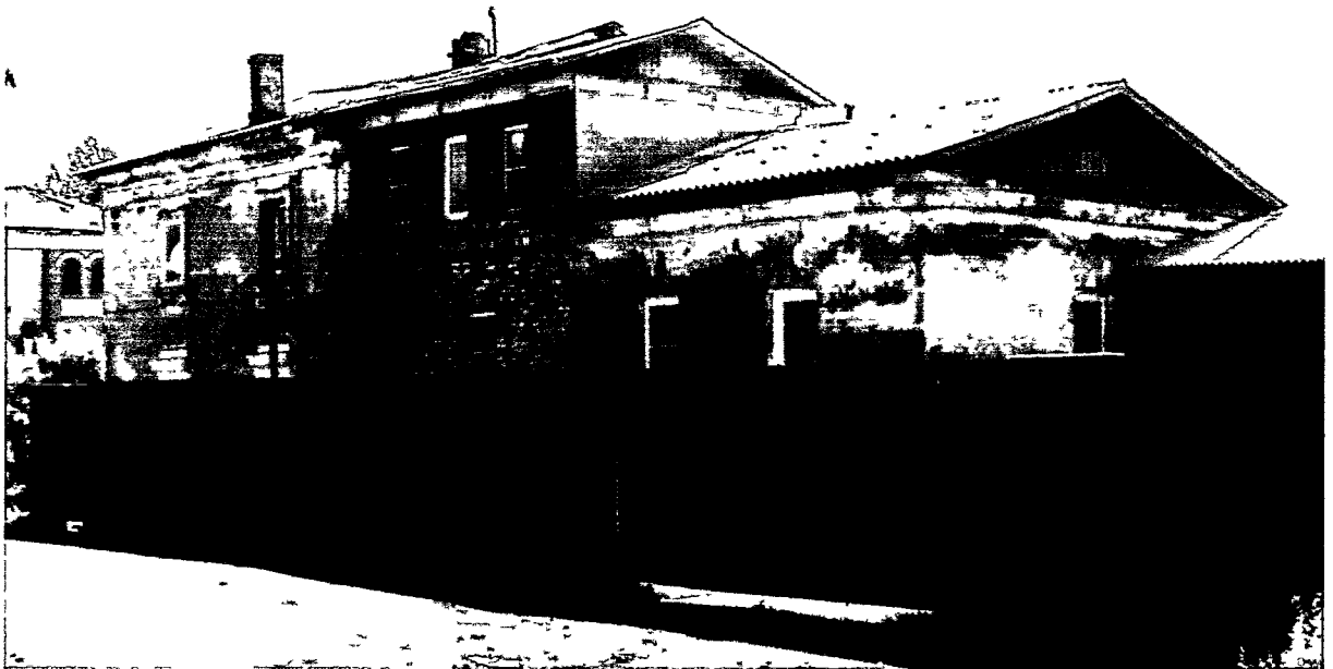
Фото Н.В. Шастун, август 2018 г.