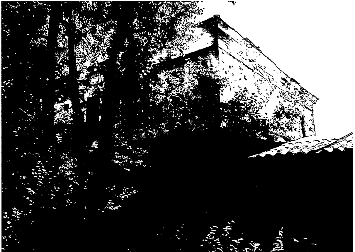
Фото Н.В. Шастун, август 2018 г.

(Лит. Ж) Фрагмент торцевого (южного) фасада.