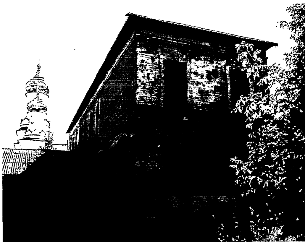
август 2018 г.

(Лит. К) Вид на здание с северо-западного угла.