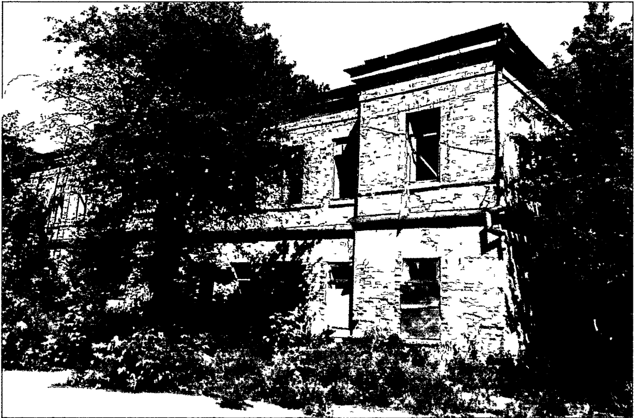
Фото Н.В. Шастун, август 2018 г.