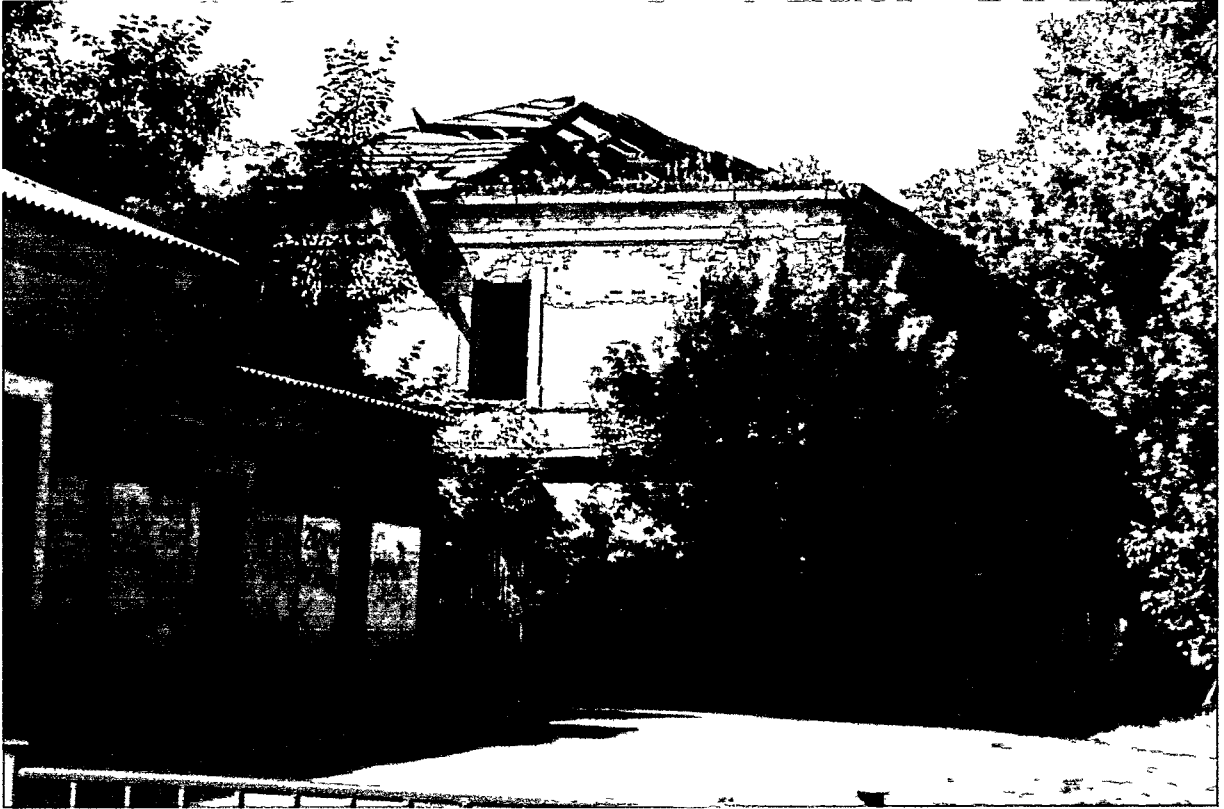
Фото Н.В. Шастун, август 2018 г.

(Лит. Ж) Фрагмент торцевого (южного) фасада.