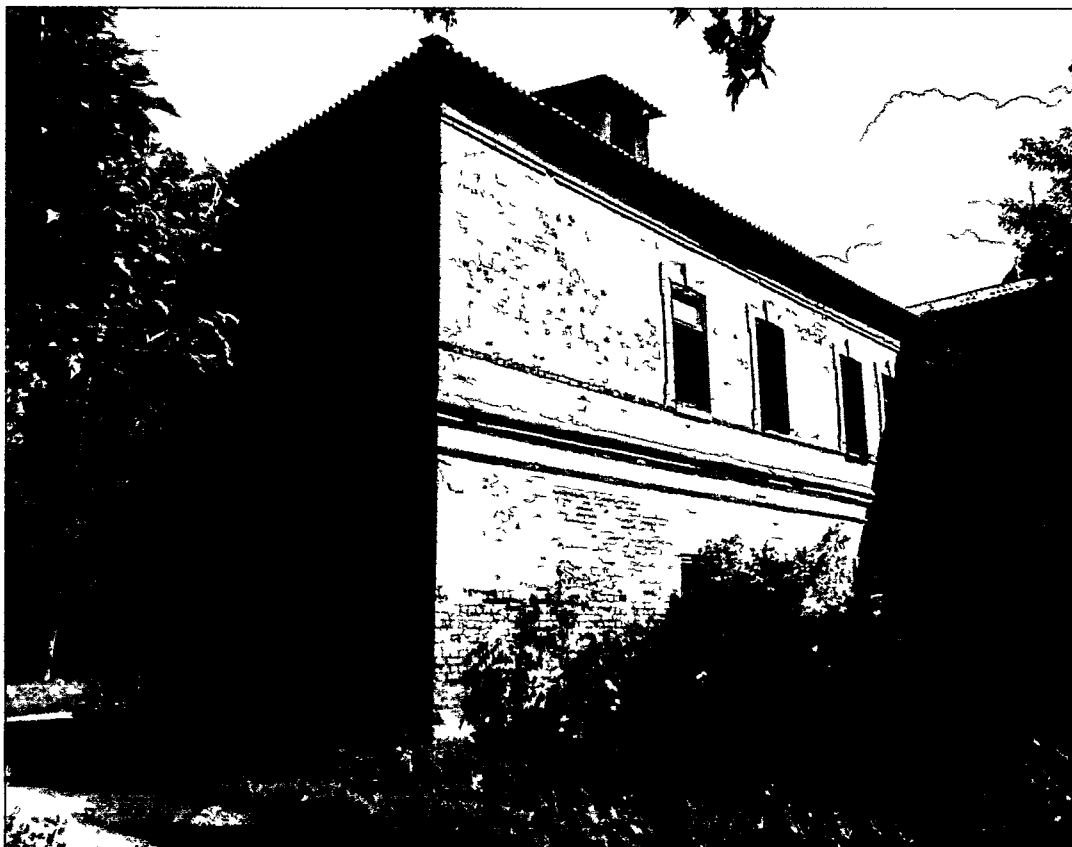
Фото Н.В. Шастун, август 2018 г.

(Лит. К) Вид на здание с северо-западного угла.