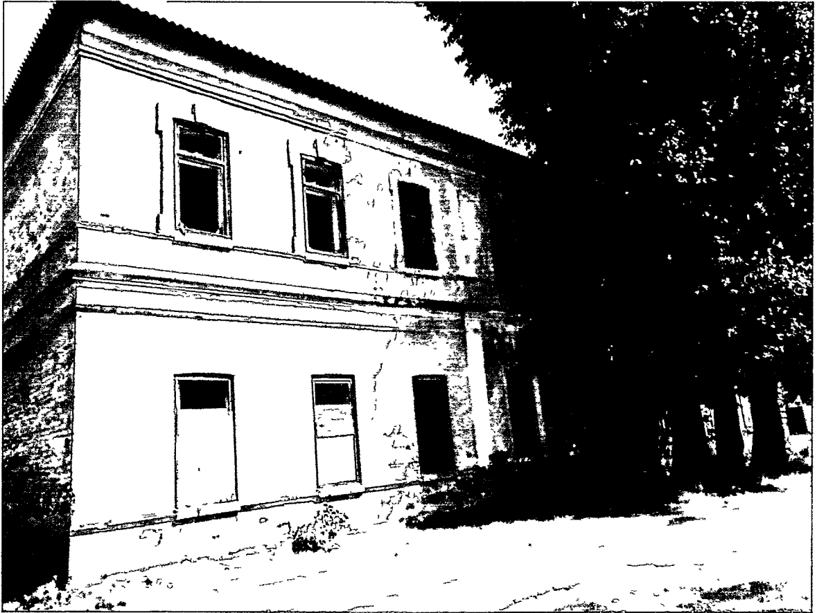
Фото Н.В. Шастун, август 2018 г.

(лит. К) Западный фасад. Вид с северо-западного угла.