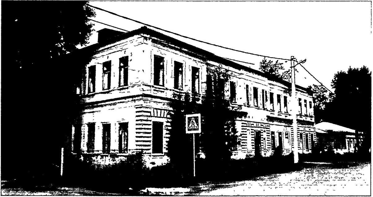
август 2018 г.

(лит. К) Общий вид здания с юго-западного угла.