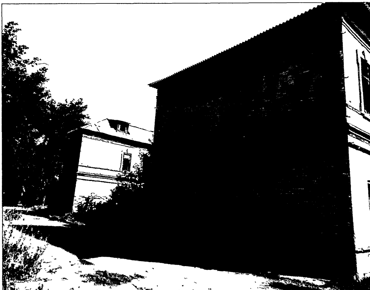
Фото Н.В. Шастун, август 2018 г.

(Лит. К) Вид на здание с северо-западного угла.