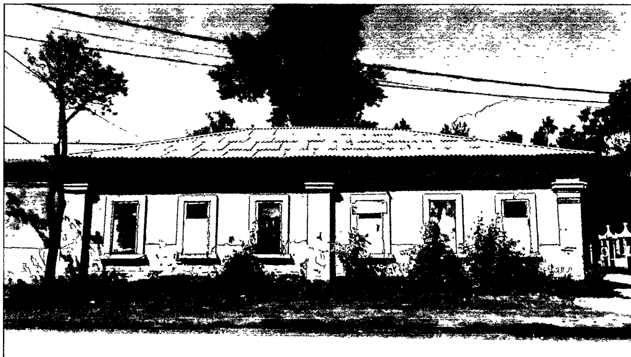
Фото Н.В. Шастун, август 2018 г.

(Лит. К) Вид на здание с северо-востока.