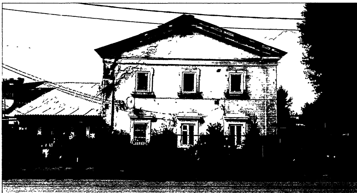
Фото Н.В. Шастун, август 2018 г.