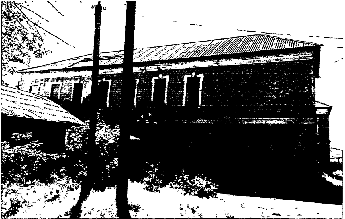
август 2018 г.