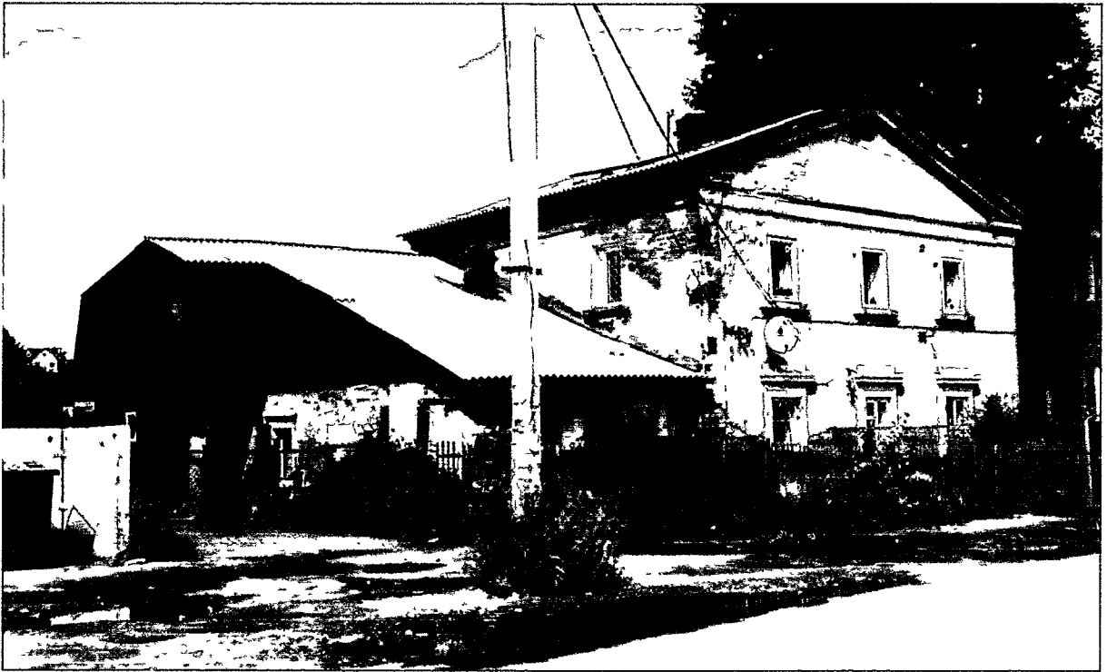
август 2018 г.