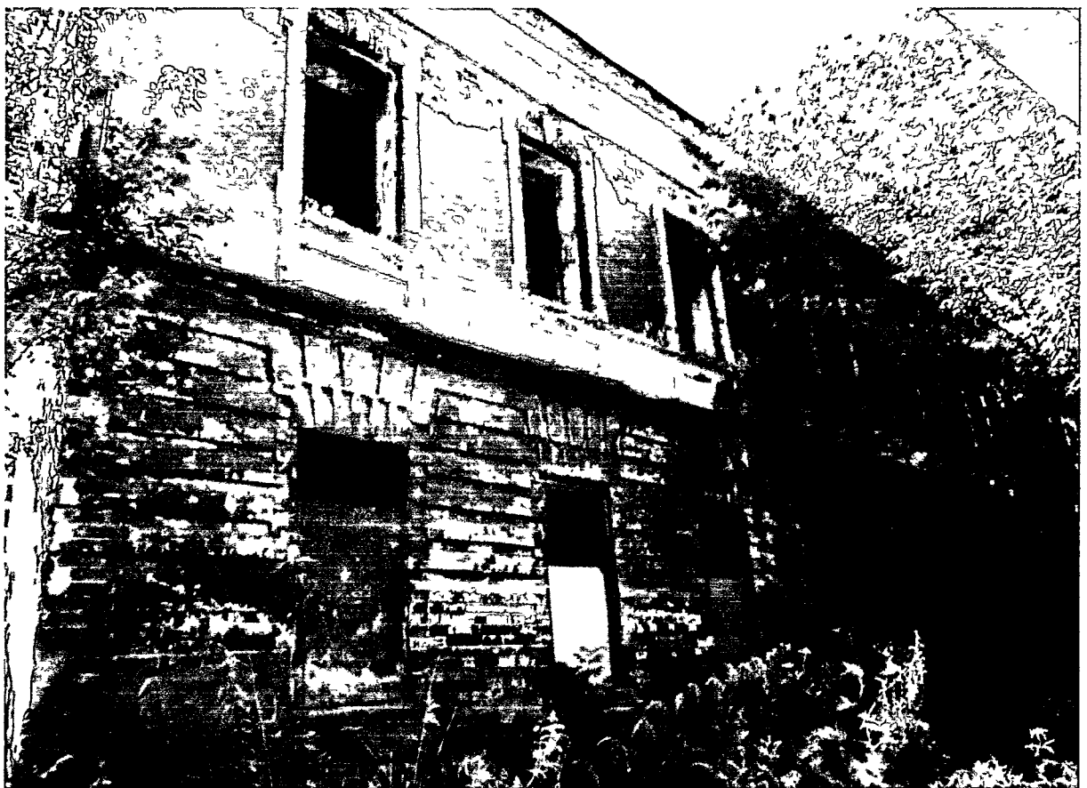
Фото Н.В. Шастун, август 2018 г.