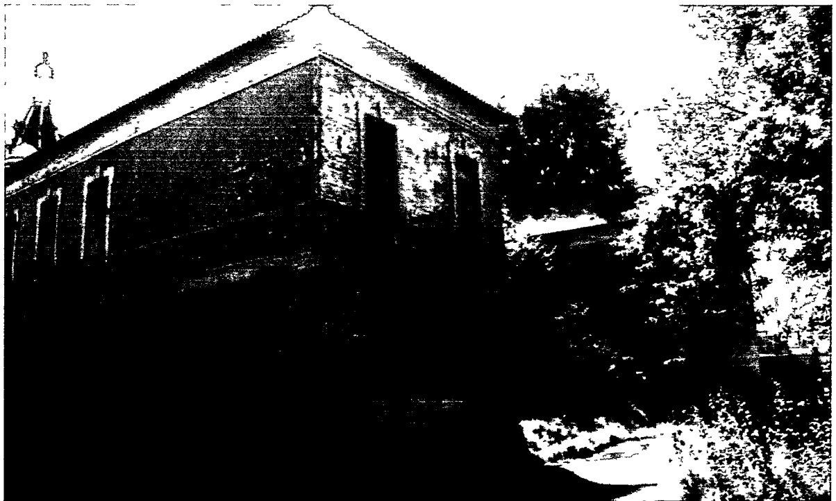
Фото Н.В. Шастун, август 2018 г.