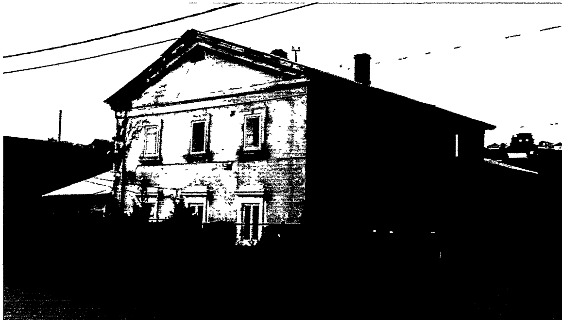
Фото Н.В. Шастун, август 2018 г.

Фотографическое изображение объекта культурного наследия регионального значения «Ансамбль», кон. XIX в., расположенного по адресу: г. Иркутск, ул. Каштаковская, 55 лит. А, А2, А3, а; лит. К; лит. З; лит. Ж; (адрес объекта по Решению исполнительного комитета Иркутского областного Совета народных депутатов № 73, прил. 1, п. 85 от 22 февраля 1990 года: г. Иркутск, ул. Каштаковская, 52-53;) (на момент утверждения охранного обязательства) на 11 листах.