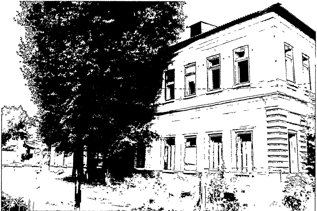
Фото Н.В. Шастун, август 2018 г.

(лит. К) Западный фасад. Вид с северо-западного угла.