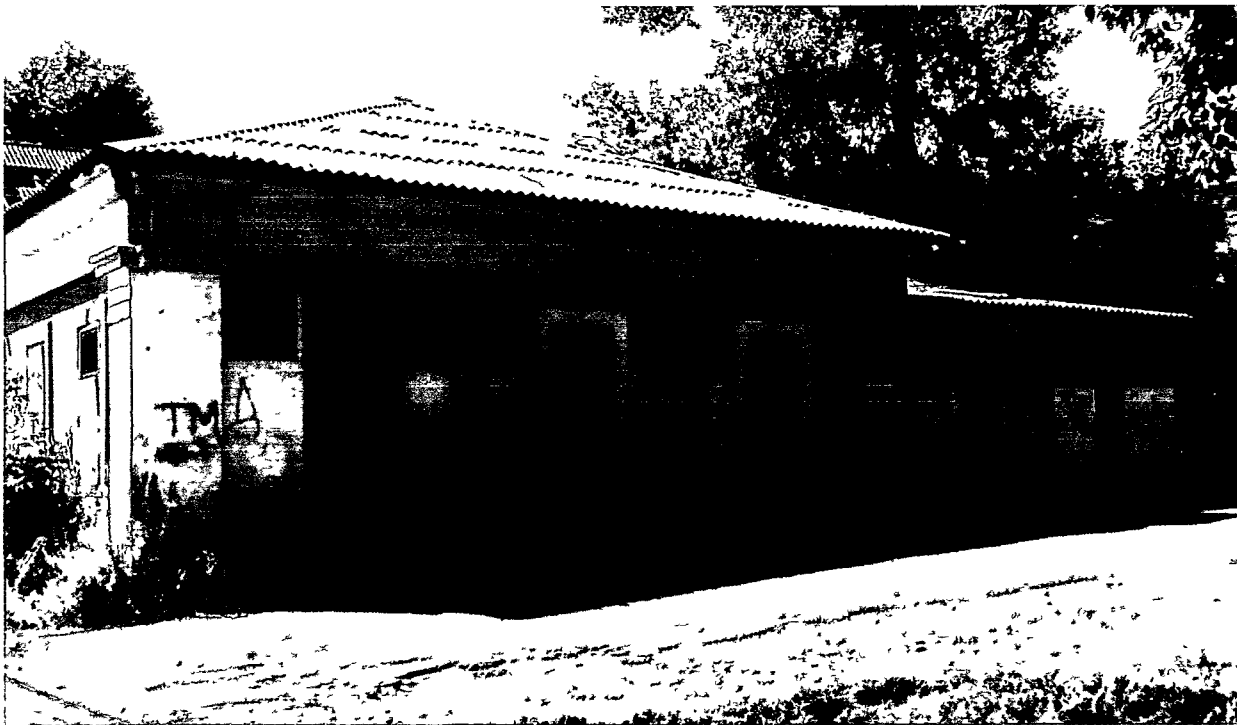
Фото Н.В. Шастун, август 2018 г.