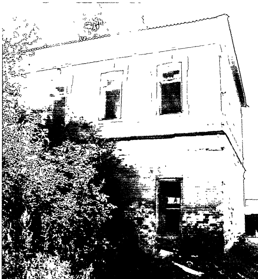
август 2018 г.

(Лит. К) Вид на здание с северо-востока.