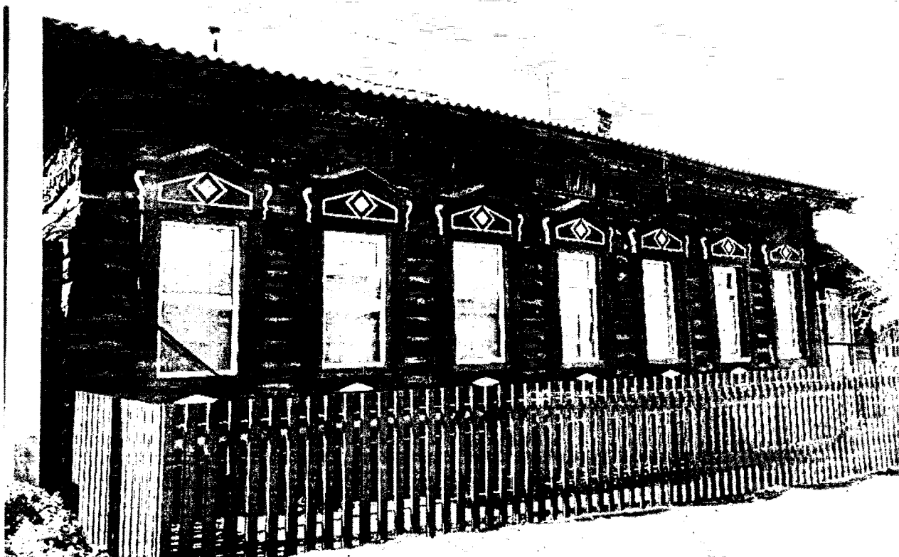
Фото 1 – Главный северо-восточный фасад дома по ул. Гончарной