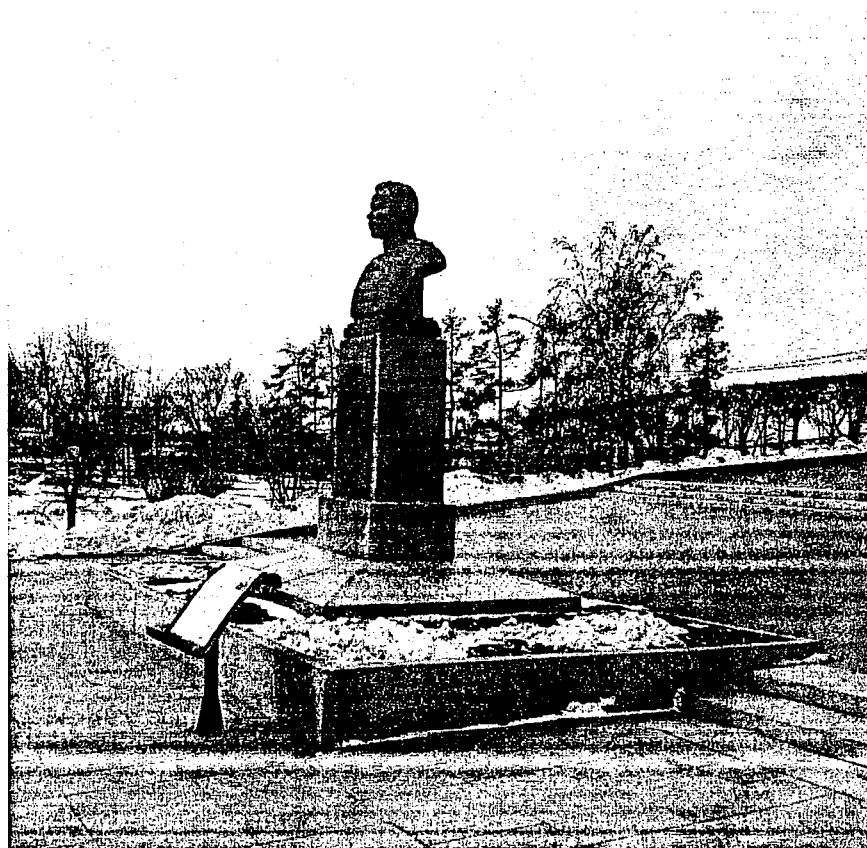
Фото 2. Вид с восточной стороны