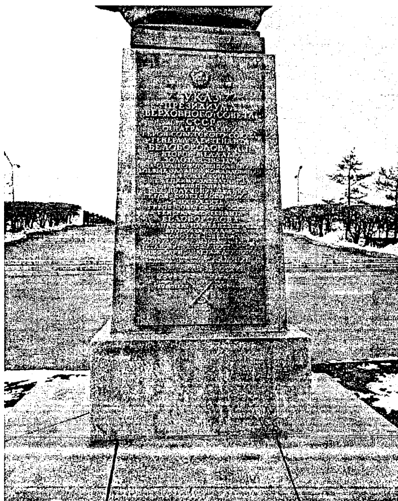
Фото 4. Бронзовая литая плита с текстом Указа