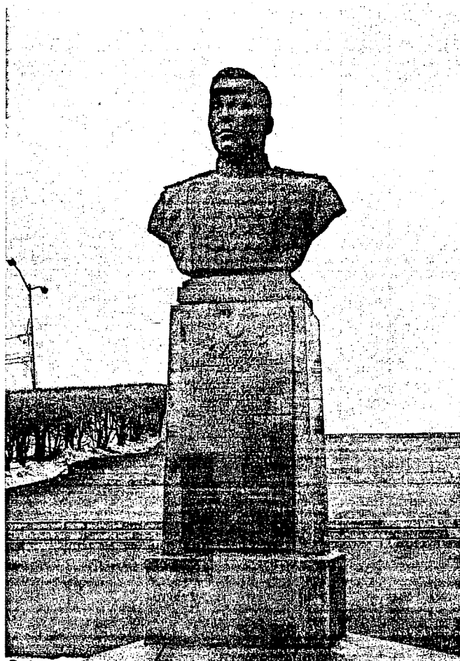
Фото 3. Двухступенчатый постамент с бюстом