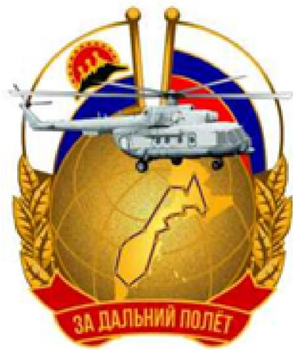
Рисунок нагрудного знака «За дальний полёт»