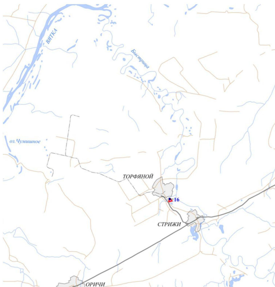
СХЕМА границ участка № 1 особо охраняемой природной территории регионального значения «Зеленая зона городов Кирова, Кирово-Чепецка и Слободского»

к границам участка № 1 особо охраняемой природной территории регионального значения «Зеленая зона городов Кирова, Кирово-Чепецка и Слободского»