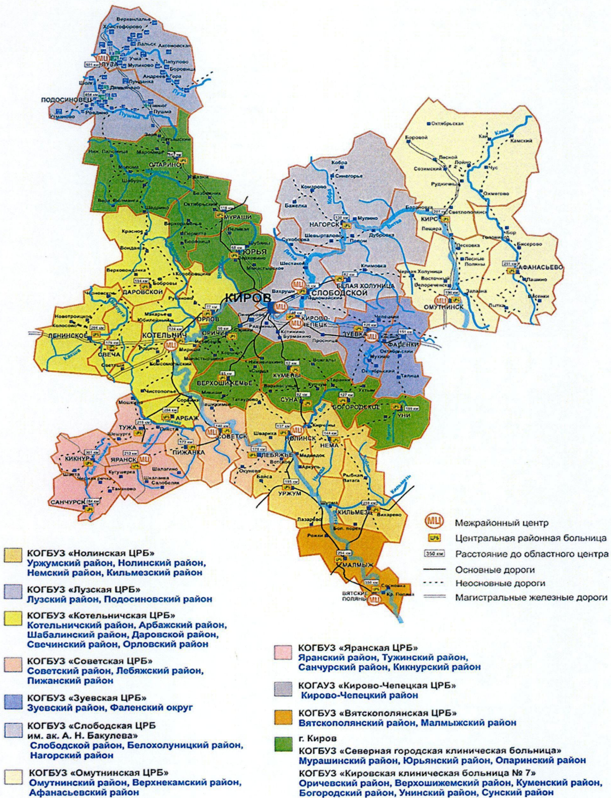
Рис. 2. Схема размещения межрайонных лечебно-диагностических центров