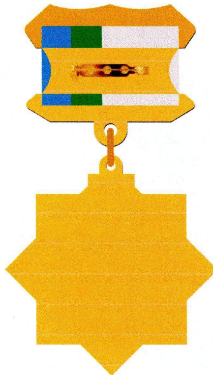
Рис. Изображение нагрудного знака