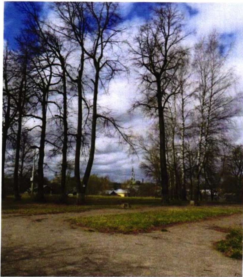
Вид с территории парка на Колокольню Казанского собора