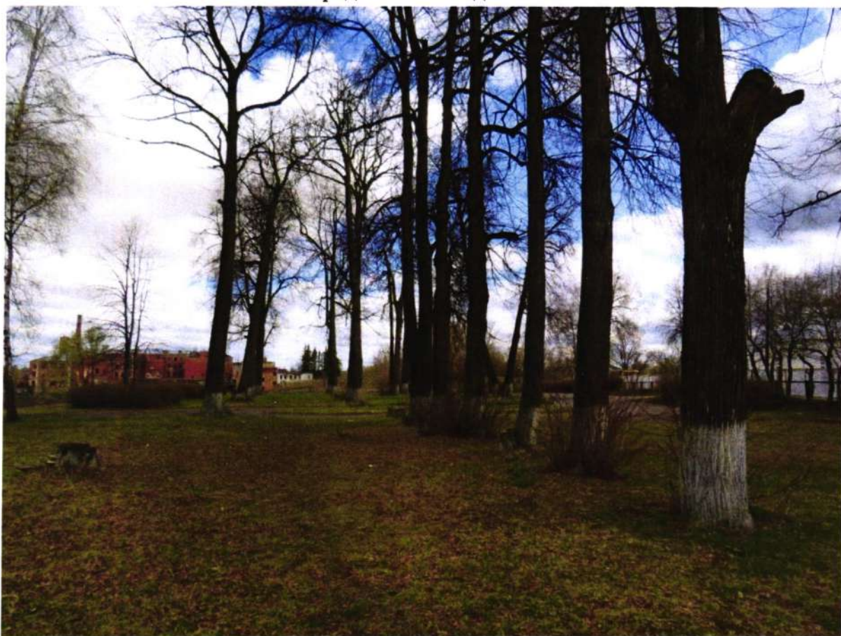
Вид с юго-запада на центральную аллею.

Основные видовые раскрытия на центральную аллею с рядовыми посадками лип.