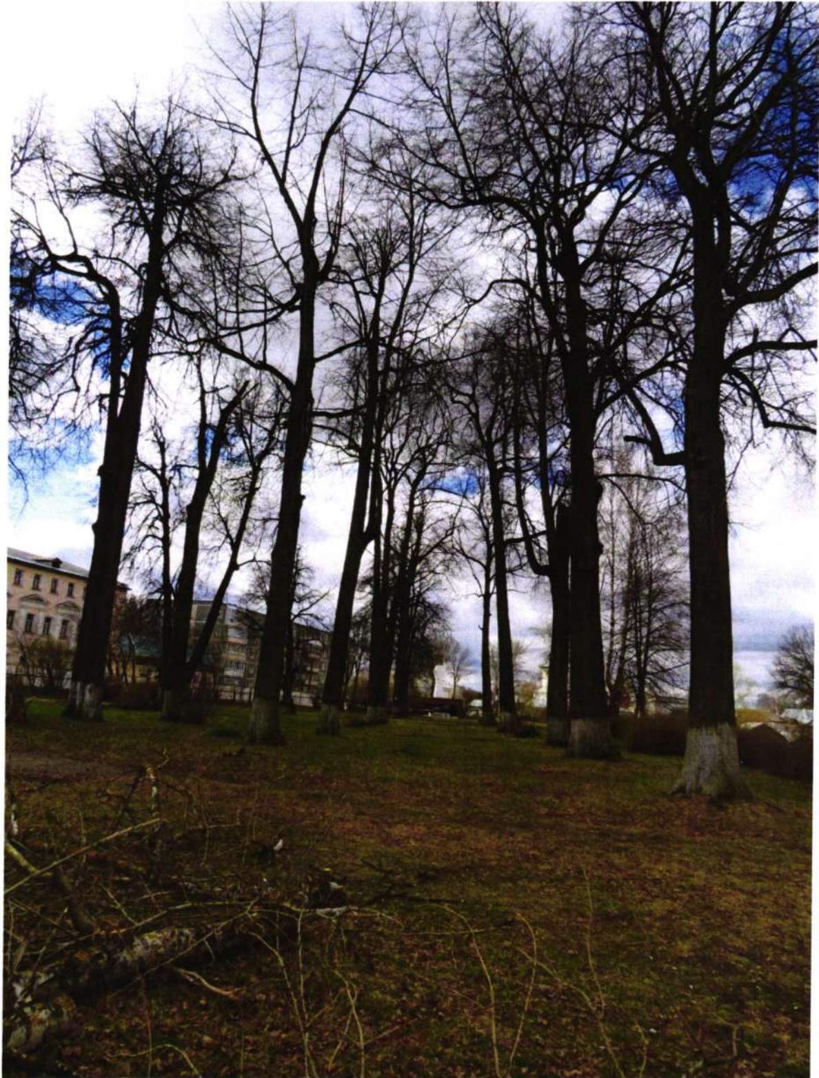
Вид с северо-востока на центральную аллею.