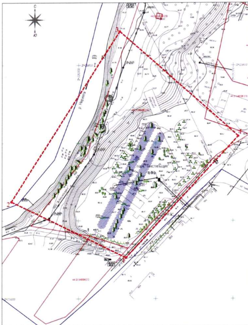
Схема расположения парка, конфигурация его территории, основные элементы планировочной структуры