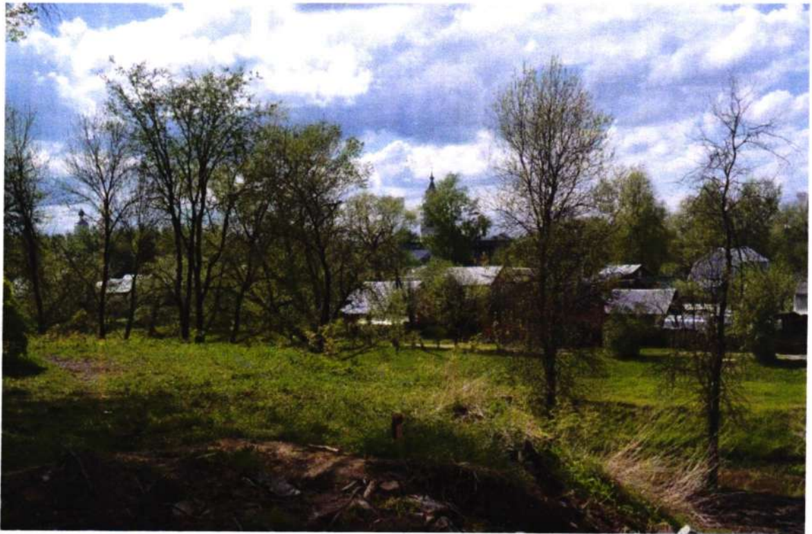
Вид с территории парка на Преображенскую церковь, ул. Красноармейская 10