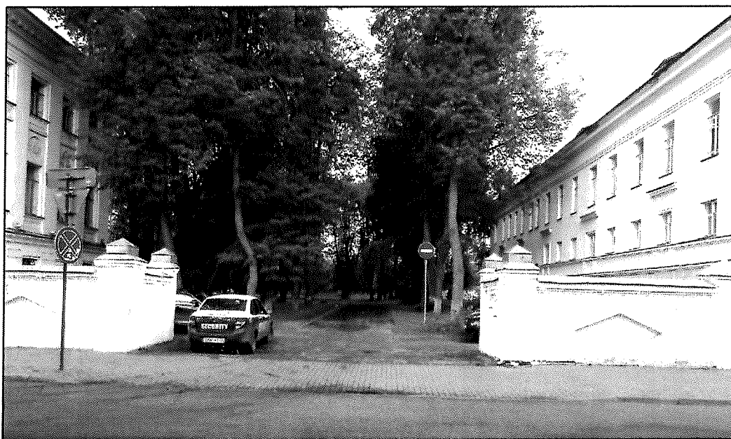
Вид на южную часть парка со стороны ул. Ленина