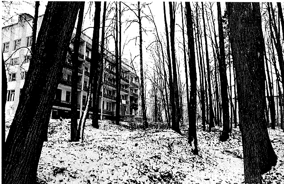
Рядовые посадки вдоль южной граничной канавы