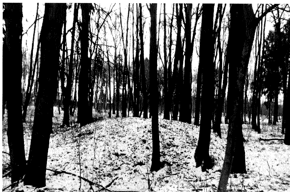
Вид на холм с ул. Михалевского