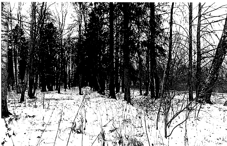
Существующие насаждения лип и елей в западной части парка