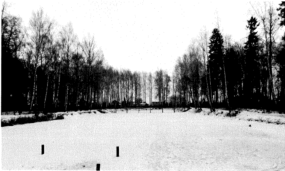
Вид на пруд с юга