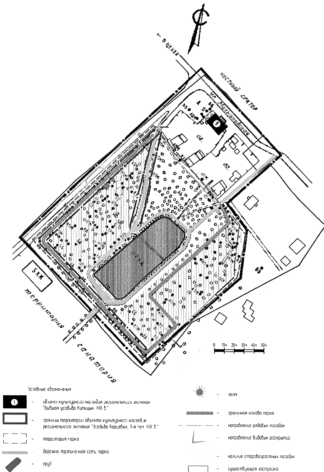
Планировочная структура парка