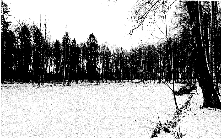
Вид на пруд с главной аллеи