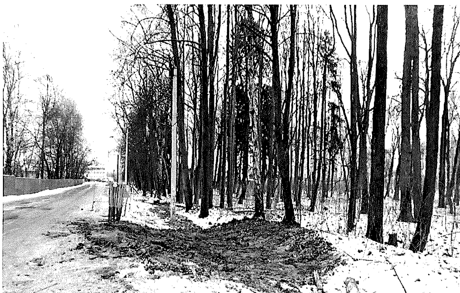
Рядовые посадки вдоль западной граничной канавы