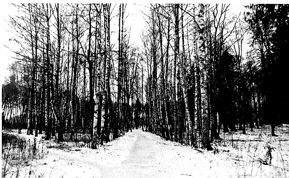
Рядовые посадки берез вдоль главной аллеи