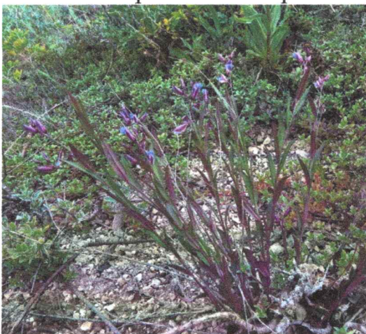
Фото 7. Зубянка луковичная