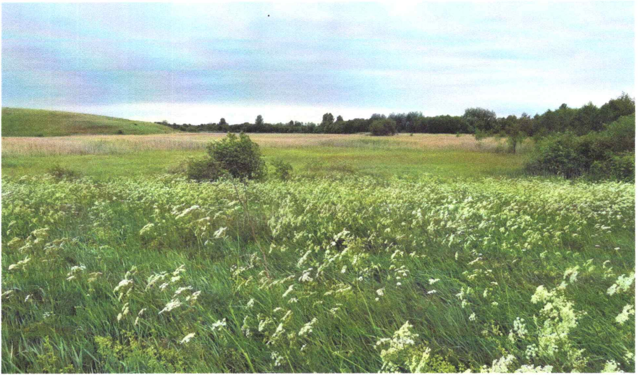
Фото 4. Пойменный луг реки Рогозец