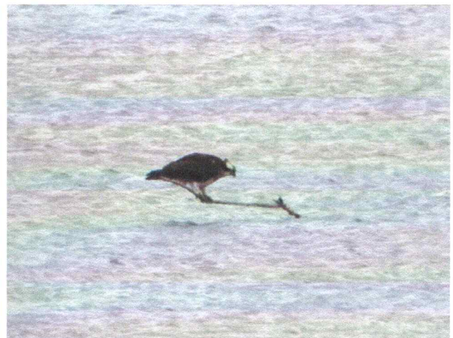
Фото 12. Скопа