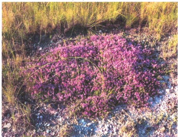
Фото 8. Тимьян меловой