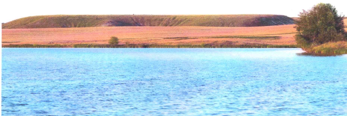
Фото 1. Общий вид планируемой особо охраняемой природной территории «Степные холмы и пойма реки Рогозец близ деревни Безлепкино»