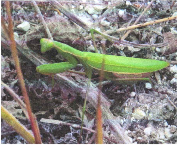
Фото 9. Богомол обыкновенный