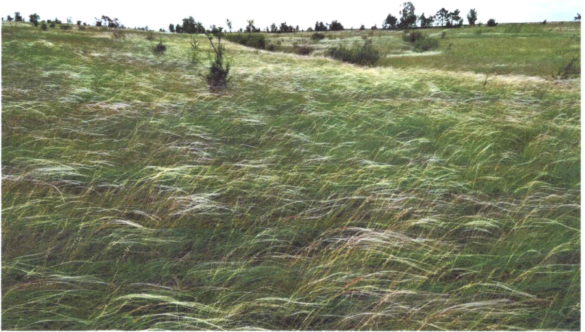
Фото 2. Ковыльная степь