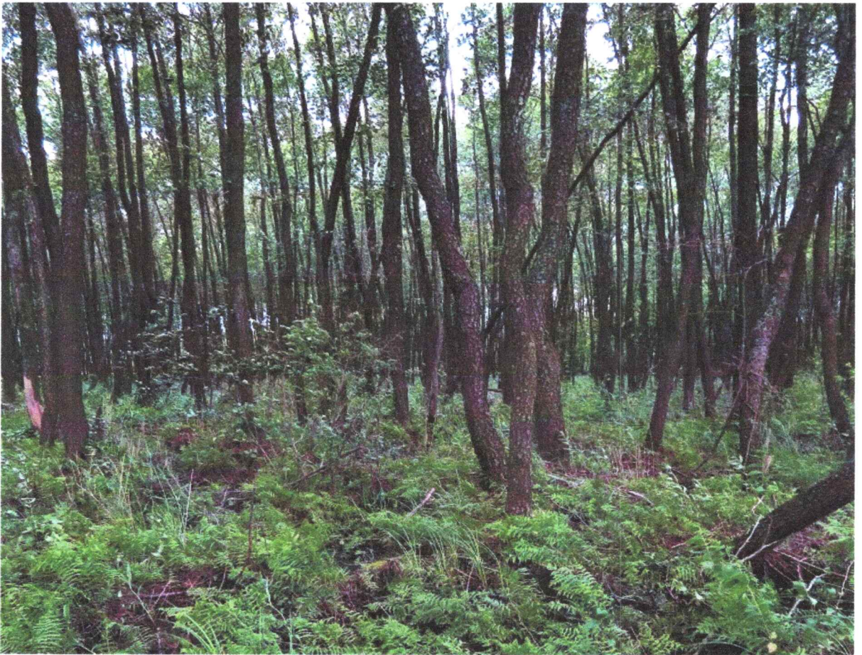
Фото 3. Пойменный ольшаник с телиптерисом болотным