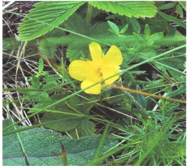
Фото 6. Солнцецвет монетолистный