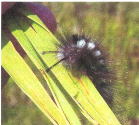
Фото 11. Шерстолапка лунчатая