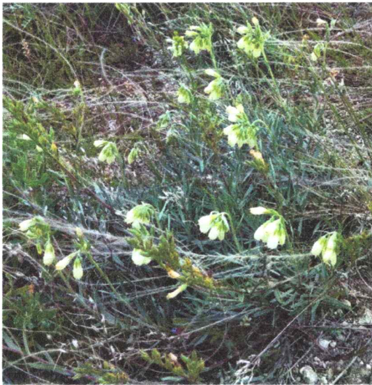
Фото 5. Пролеска сибирская