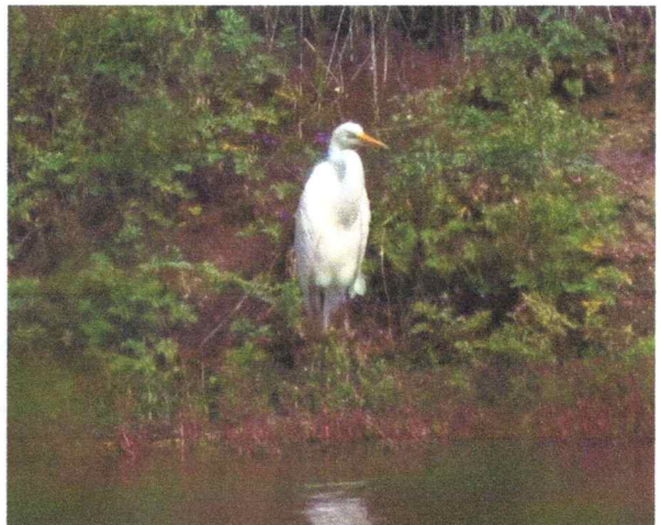
Фото 14. Большая белая цапля