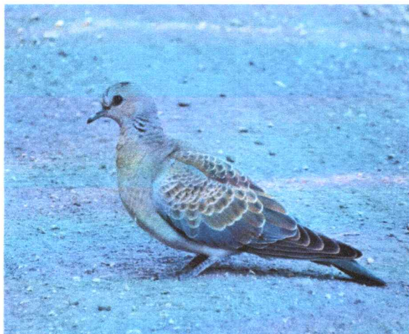
Фото 13. Горлица