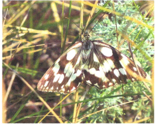
Фото 10. Пестроглазка галатея