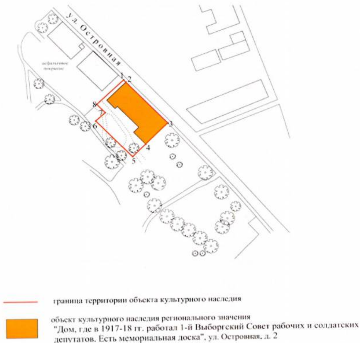
Карта (схема) границ территории объекта культурного наследия

Границы территории объекта культурного наследия регионального значения «Дом, где в 1917-18 гг. работал 1-й Выборгский Совет рабочих и солдатских депутатов. Есть мемориальная доска», расположенного по адресу: Ленинградская область, Выборгский муниципальный район, г. Выборг, ул. Островная, д. 2