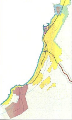
деревня Сторожно МАСШТАБ 1:10 000