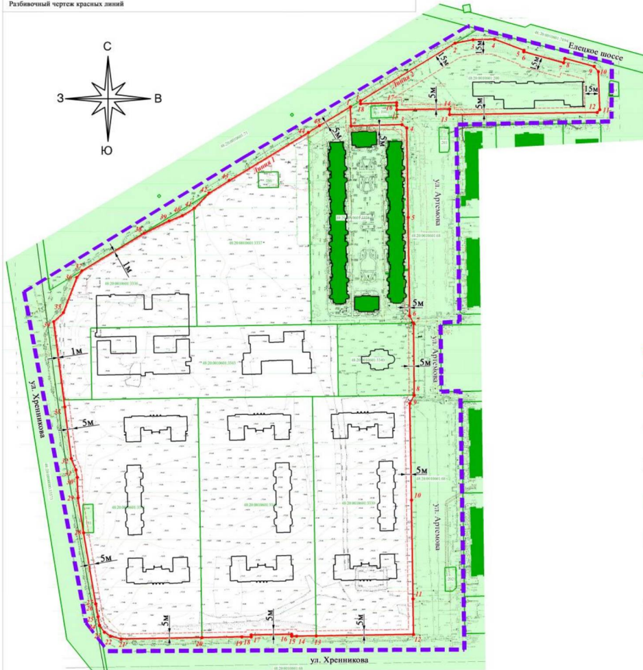
Каталог координат характерных точек красных линий

Проект внесения изменений в проект планировки и проект межевания территории микрорайона «Елецкий» в городе Липецке Разбивочный чертеж красных линий