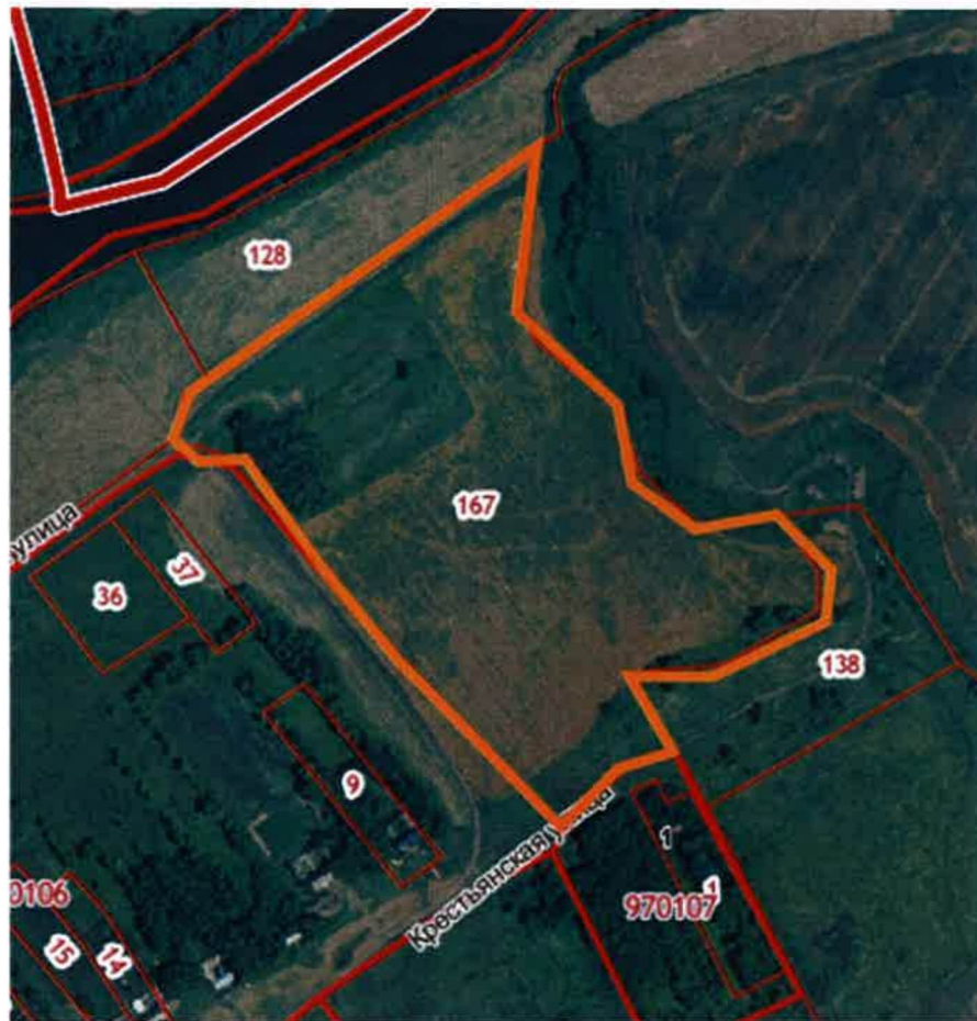
Схема границ территории документации по планировке территории (проект планировки и проект межевания) в районе Крестьянской и Луговой в с. Голиково Елецкого муниципального района