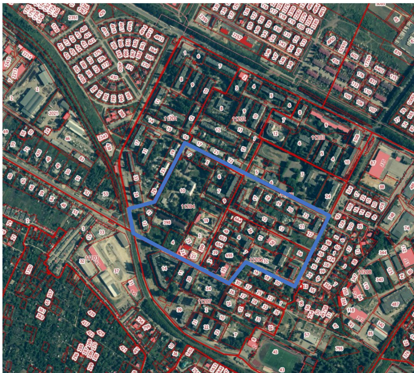
Схема границ подготовки документации по планировке территории (проект планировки и проект межевания), ограниченной улицами Юношеская, Metallистов, Базарная, Детская и переулком Рудный в городе Липецке