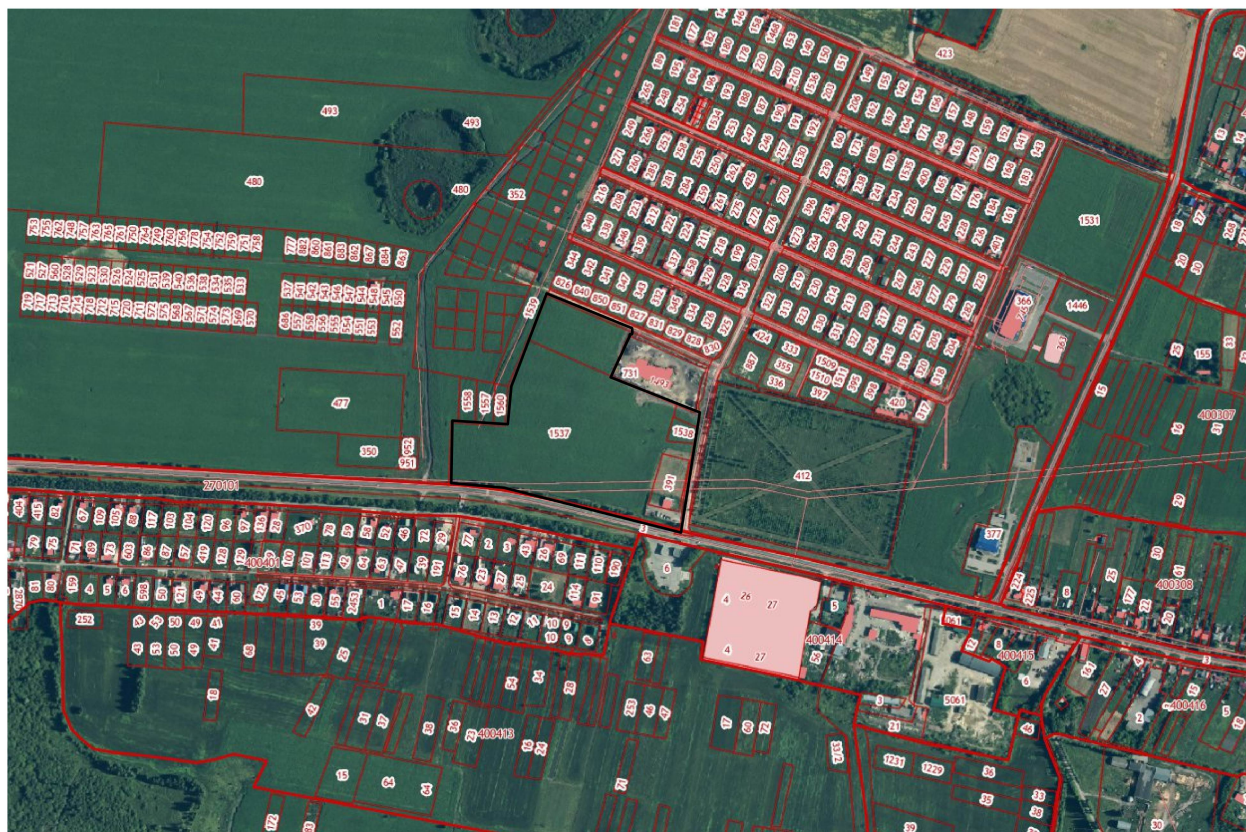
Схема границ территории документации по планировке территории (проект планировки и проект межевания) в районе улицы Ленина и переулка Парковый в селе Доброе Добровского муниципального округа