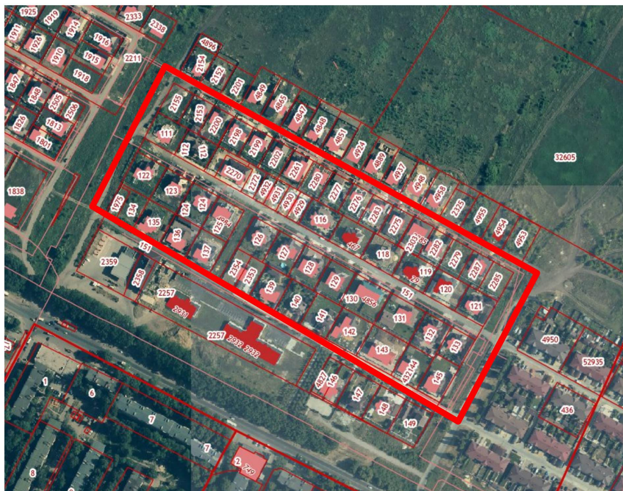
Схема границ территории для подготовки документации по планировке территории (проект планировки и проект межевания) в районе переулков Чистый, Любимый, Дружный в городе Липецке