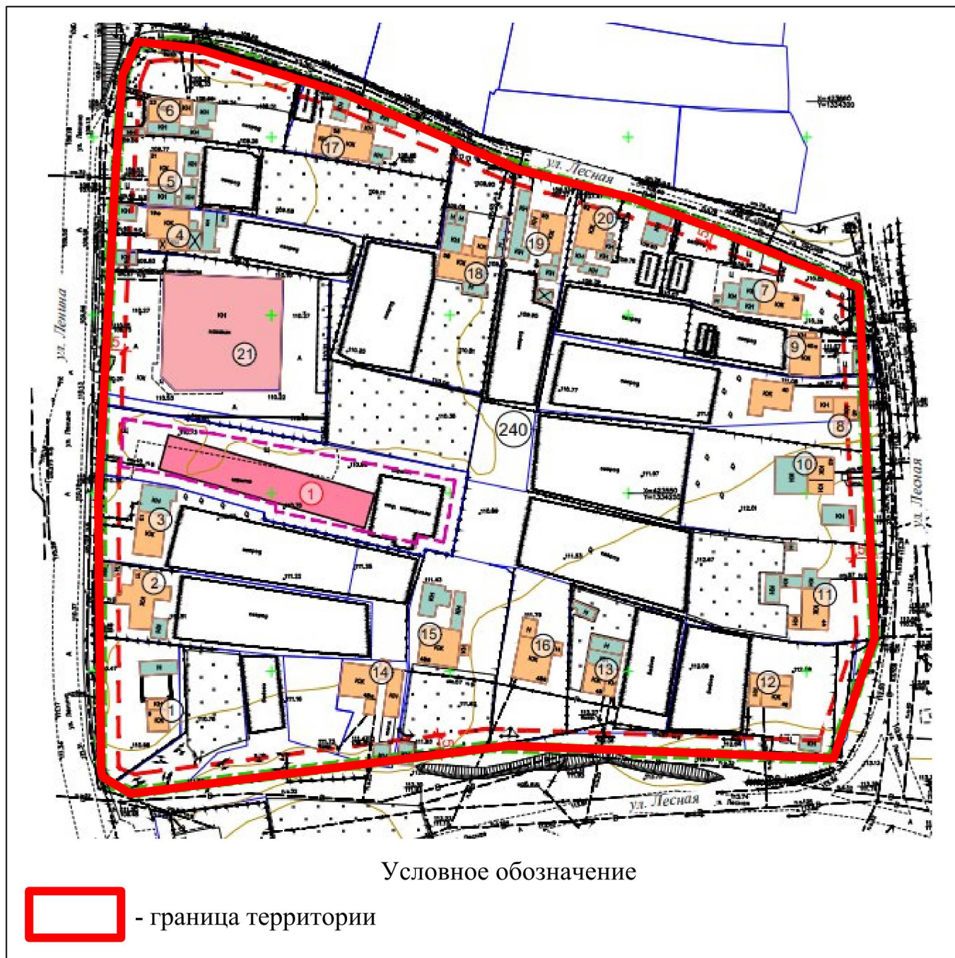
Схема границ территории для подготовки проекта изменений в документацию по планировке территории (проект планировки и проект межевания) квартала в районе улиц Ленина и Лесная (Сселки, квартал № 240)