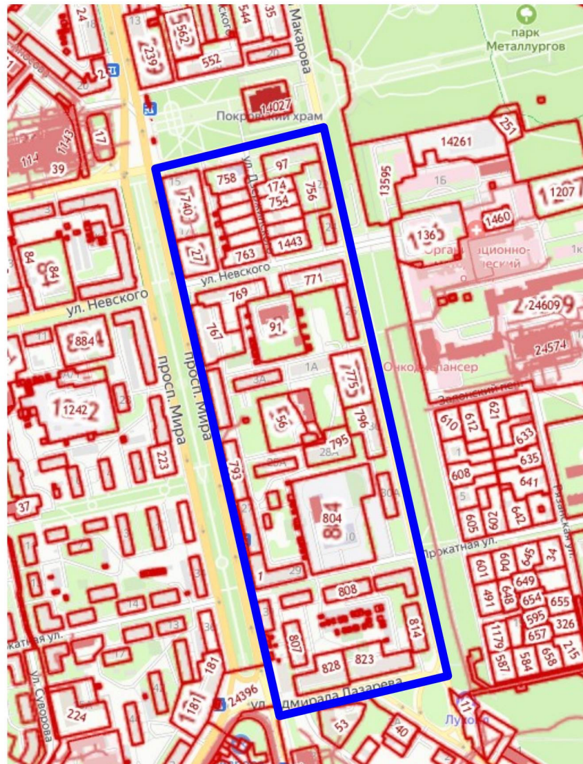
Схема границ территории для подготовки проекта межевания территории, ограниченной улицами Парковая, Адмирала Макарова, Адмирала Лазарева, проспектом Мира в городе Липецке

к приказу управления строительства и архитектуры Липецкой области 05.04.2024 № 135